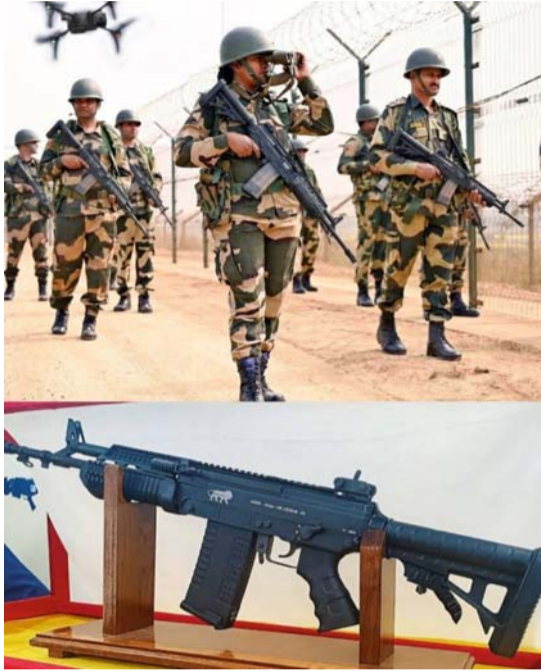
చేయడంతో ఈ వేగం సాధ్యమైంది. ప్రైవేట్ రంగ స్టాల్స్ బల

హైదరాబాద్ : తెలంగాణకు చెందిన రక్షణ స్టాల్స్ 'డ్యూస్ డిఫెన్స్' డిఆర్డివోతో కలిసి అద్భుతం చేసింది. ఆపరేషన్ సిందూర్ తర్వాత స్వదేశీ ఆయుధాల తయారీపై డిఆర్డివో దృష్టి పెట్టింది. ఆత్మనిర్భర భారత్లో భాగంగా కేంద్రం కూడా రక్షణ బడ్జెట్ పెంచింది. ఈ నేపథ్యంలో తెలంగాణకు చెందిన స్టాల్స్ 7.6251 ఎంఎం క్యాలిబర్లో ఉగ్రం(జిఉఫీం) అనే దేశీ రైఫిల్ను అభివృద్ధి చేసింది. ఈ ప్రాజెక్టును కేవలం 100 రోజుల్లోనే డిజైన్ చేసి, నమూనా తయారు చేయడం రక్షణ రంగంలో మేగాన్ని పెంచింది. సాధారణంగా ఆయుధాల అభివృద్ధికి సంవత్సరాలు పట్టే పరిస్థితుల్లో ఈ వేగం ఆత్మనిర్భర భారత్ లక్ష్యానికి బలం చేకూర్చుతోంది. ఉగ్రం రైఫిల్ భారత సైన్యం, కేంద్ర హోం మంత్రిత్వ శాఖ నిర్వహించిన కఠినమైన పరీక్షలను విజయవంతంగా పూర్తి చేసింది. దీంతో కేంద్ర సాయుధ పోలీసు బలగా ఈ రైఫిల్ను తమ ఆయుధభంధారంలో చేర్చుకోవడానికి సిద్ధంగా ఉన్నాయి. సాధారణంగా విదేశీ ఆయుధాలపై ఆధారపడే సీపీఎఫ్ కు దేశీ రైఫిల్ అందుబాటులోకి రావడంతో ఖర్చు తగ్గడం, సరఫరా భద్రత పెరగడం, నిర్వహణ సౌలభ్యం వంటి ప్రయోజనాలు ఏర్పడతాయి. డిఆర్డివోకి చెందిన ఆయుధ పరిశోధన, అభివృద్ధి సంస్థలో స్టాల్స్ సంయుక్తంగా పని