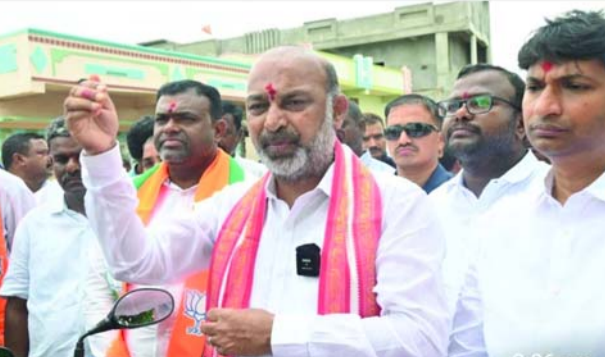
గ్యారంటీలను అమలు చేయాలని కోరుతున్నా.