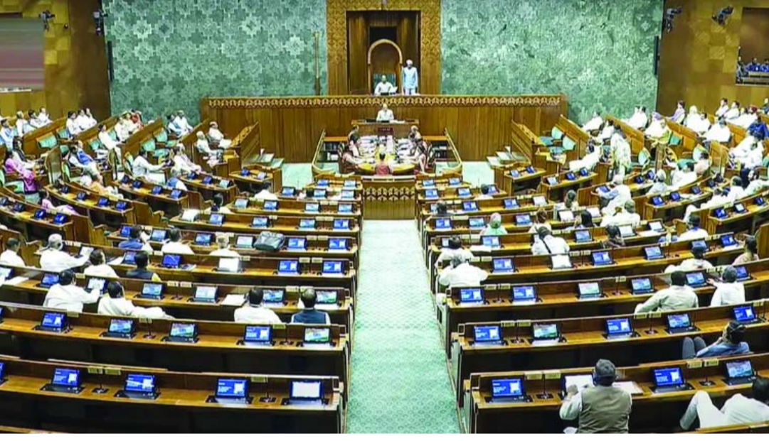
కారణంగా ఆగస్టు 13, 14 తేదీల్లో సభకు సెలవు ఉంటుంది. ఈ సమావేశాల్లోనే చర్చకు రానున్నాయి. 130వ రాజ్యాంగ సవరణ బిల్లుతో పాటు పలు కీలక బిల్లులు

డిల్లీ: రాజీయే పార్లమెంట్ వర్గాల సమావేశాల్లో కేంద్ర ప్రభుత్వం ఒక కీలక బిల్లును తీసుకురానుంది. అదే 130వ రాజ్యాంగ సవరణ బిల్లు. ఈ కొత్త చట్టం ప్రకారం.. ఏదైనా తీవ్రమైన క్రిమినల్ లేదా అవినీతి కేసులో అరెస్టయి, పరమగా 30 రోజులకు మించి జైల్లో ఉంటే సరకు ప్రజాప్రతినిధి తన పదవిని కోల్పోతారు. రాజకీయాల్లో అవినీతిని అరికట్టేందుకు తెస్తున్న ఈ చట్టం.. దేశ ప్రధాని, ముఖ్యమంత్రులు, మంత్రులతో పాటు ఎంపీలు, ఎమ్మెల్యేలందరికీ వర్తిస్తుంది. ఈ బిల్లును పరిశీలిస్తున్న సంయుక్త పార్లమెంటరీ కమిటీ ఈ సమావేశాల ప్రారంభంలోనే తన నివేదికను సభకు సమర్పించనుంది. జేపీసీ నివేదికను పరిశీలించిన తర్వాత, ఈ బిల్లును ఆమోదం కోసం ప్రభుత్వం పార్లమెంట్ ముందుకు తెస్తుంది. రాజ్యాంగ సవరణ బిల్లు కావడంతో, ఇది చట్టంగా మారాలంటే పార్లమెంట్ లోని ఉభయ సభల్లో మూడింట రెండు వంతుల మెజారిటీ అవసరం అవుతుంది పార్లమెంట్ వర్గాల సమావేశాలు జూలై 21 నుంచి ప్రారంభమై ఆగస్టు 21 వరకు జరగనున్నాయి. కేంద్ర పార్లమెంటరీ వ్యవహారాల మంత్రి వెల్లడించిన వివరాల ప్రకారం.. ఈ సమావేశాలకు సంబంధించిన ప్రతిపాదనకు రాష్ట్రపతి ద్రౌపది ముర్ము ఆమోదం తెలిపారు. స్వాతంత్ర్య దినోత్సవ వేడుకల