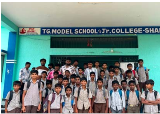
- విద్యార్థుల సమస్యల పరిష్కారమే లక్ష్యం - పెండింగ్ బకాయిలు విడుదల చేయాలని వామపక్ష విద్యార్థి సంఘాల డిమాండ్

చేవెళ్ల, జూలై 10 (ప్రజా జ్యోతి): విద్యారంగంలో పేరుకుపోయిన సమస్యలను వెంటనే పరిష్కరించాలని డిమాండ్ చేస్తూ వామపక్ష విద్యార్థి సంఘాల రాష్ట్రవ్యాప్త పిలుపు మేరకు శుక్రవారం చేవెళ్ల మండల కేంద్రంలో నిర్వహించిన విద్యాసంస్థల బండ్ విజయవంతమైంది. బండ్ లో భాగంగా పాఠశాలలు, కళాశాలల వద్ద విద్యార్థి సంఘాల నాయకులు నిరసన చేపట్టి ప్రభుత్వానికి మౌఖికంగా నివాదాలు చేశారు.