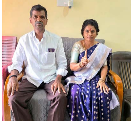
ఆరోపణలు చేస్తున్నారన్నారు ఇలాంటి ఆరోపణలకు భయపడే ప్రసక్తి లేదని తాము చేసిన అభివృద్ధిని ప్రజలందరూ ఆదరిస్తున్నారు. ప్రజలంతా ఎవరు ఏం చేస్తున్నారో అనే విషయాలను కూడా ఎప్పటికప్పుడు గమనిస్తున్నారని తెలిపారు. ఎవరెన్ని తప్పులు ఆరోపణ చేసిన తాము గ్రామ అభివృద్ధి కొరకే పాటు పడతామన్నారు.

చేయాలని ఉద్దేశంతోనే సర్పంచ్ గా గెలవడం జరిగిందన్నారు. సర్పంచ్ గా గెలిచి ఆరు నెలలు గడిచిన లోపే ఎమ్మెల్యే ప్రకాష్ గౌడ్ సహకారంతో 32 లక్షల నిధులు తీసుకువచ్చి సీసీ రోడ్లు వేయడం జరిగిందన్నారు. అంతే కాకుండా మూడు లక్షల రూపాయలతో సీసీ కెమెరాలను ఏర్పాటు చేశామన్నారు. గ్రామానికి ఎన్ని రోజులుగా సర్పంచులుగా చేశారని కానీ గ్రామంలో ఇప్పటివరకు మూడు ఫేసుల కరెంటు లేదని, దానిని దృష్టిలో ఉంచుకొని గ్రామ ప్రజల కొరకు 24 గంటలపాటు ట్రీఫేస్ ఉండేలా మూడుఫేసుల కరెంటును కూడా తీసుకురావడం జరిగిందన్నారు. గ్రామంలో ఉన్న ఎల్లమ దేవాలయాన్ని కూడా దాతల సహకారంతో అభివృద్ధి చేశామన్నారు. ప్రభుత్వం నుంచి వచ్చిన సంక్షేమ పథకాలను ప్రతి ఒక్క అర్హులకు అందించడం జరిగిందన్నారు ఇందిరమ్మ ఇండ్ల పథకంలో గ్రామంలో 11 మందికి ఇల్లు మంజూరయ్యాయి అని అవి పూర్తి కావడం జరిగిందన్నారు. త్వరలో ఎమ్మెల్యే ప్రకాష్ గౌడ్ సహకారంతో నూతనంగా నిర్మించిన సీసీ రోడ్లతో పాటు గృహప్రవేశాలు కూడా చేస్తామన్నారు. గ్రామంలో ఇదంతా అభివృద్ధి చేస్తుంటే ప్రతిపక్ష పార్టీకి చెందిన కొందరు నాయకులు కావాలని తప్పులు