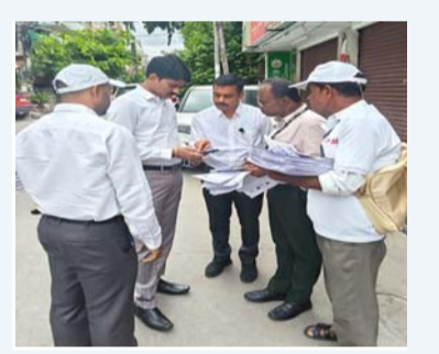
అబ్దుల్లాపూర్ మెట్ట జూలై 03(ప్రజాజ్యోతి) ప్రత్యేక ఓటరు జాబితా సవరణ( ఎన్ఐఆర్) కార్యక్రమాన్ని పారదర్శకంగా నిర్వహించే గడువులో పూర్తి చేయాలని రంగారెడ్డి జిల్లా కలెక్టర్ సి.నారాయణ రెడ్డి అధికార యంత్రాంగాన్ని ఆదేశించారు. శుక్రవారం ఎల్సీసీ నగర్ జోన్ లో ఆయన జోన్ లో కమిషనర్ శ్రీ వికాస్ మహతో కలిసి ఎస్సయిమరేషన్ ఫారాల పంపిణీ ప్రక్రియను తనిఖీ చేయడం జరిగింది. బూత్ స్థాయి అధికారులు (బిఎల్ఓలు) ఇంటింటికి వెళ్లి ఓటర్లకు ఎస్సయిమరేషన్ ఫారాలను అందజేస్తూ వివరాలను సమోదయ చేస్తున్న తీరును కలెక్టర్ సి.నారాయణరెడ్డి స్వయంగా పరిశీలించారు. ఫారాల పంపిణీ సమయ ప్రక్రియలో ఎలాంటి నిర్లక్ష్యం లేకుండా ప్రతి అర్హత కలిగిన ఓటర్లను గుర్తించి జాబితాలో చేర్చాలని సూచించారు. ఓటర్ల వివరాల సేకరణలో పారదర్శకతకు ప్రాధాన్యం ఇవ్వాలని ప్రజలకు అవసరమైన సమాచారాన్ని అందించాలని అధికారులను ఆదేశించారు. ఇంట్లో లేని వారి వివరాలను స్థానికుల సహకారంతో సమోదయ చేసి మరోసారి మరోసారి సందర్శించి ఫారాలను అందజేయాలని సూచించారు. అర్హులైన ప్రతి ఒక్కరి పేరు ఓటరు జాబితాలో సమోదయ కావాలనే లక్ష్యంతో అధికారులు సమన్వయంతో పని చేయాలని ఎస్సయిల ప్రక్రియ పై ప్రజల్లో విశ్వాసం పెంపొందే చర్యలు తీసుకోవాలని కలెక్టర్ స్పష్టం చేశారు. క్షేత్రస్థాయిలో బిఎల్ఓ ల పనితీరును నిరంతరం పర్యవేక్షిస్తూ కార్యక్రమాన్ని విజయవంతం చేయాలని సంబంధిత అధికారులకు ఆదేశాలు జారీ చేశారు.

బిఎల్ఓ లకు రంగారెడ్డి జిల్లా కలెక్టర్ సి.నారాయణ రెడ్డి దిశా నిర్దేశం అబ్దుల్లాపూర్ మెట్ట జూలై 03(ప్రజాజ్యోతి) ప్రత్యేక ఓటరు జాబితా సవరణ( ఎన్ఐఆర్) కార్యక్రమాన్ని పారదర్శకంగా నిర్వహించే గడువులో పూర్తి చేయాలని రంగారెడ్డి జిల్లా కలెక్టర్ సి.నారాయణ రెడ్డి అధికార యంత్రాంగాన్ని ఆదేశించారు. శుక్రవారం ఎల్సీసీ నగర్ జోన్ లో ఆయన జోన్ లో కమిషనర్ శ్రీ వికాస్ మహతో కలిసి ఎస్సయిమరేషన్ ఫారాల పంపిణీ ప్రక్రియను తనిఖీ చేయడం జరిగింది. బూత్ స్థాయి అధికారులు (బిఎల్ఓలు) ఇంటింటికి వెళ్లి ఓటర్లకు ఎస్సయిమరేషన్ ఫారాలను అందజేస్తూ వివరాలను సమోదయ చేస్తున్న తీరును కలెక్టర్ సి.నారాయణరెడ్డి స్వయంగా పరిశీలించారు. ఫారాల పంపిణీ సమయ ప్రక్రియలో ఎలాంటి నిర్లక్ష్యం లేకుండా ప్రతి అర్హత కలిగిన ఓటర్లను గుర్తించి జాబితాలో చేర్చాలని సూచించారు. ఓటర్ల వివరాల సేకరణలో పారదర్శకతకు ప్రాధాన్యం ఇవ్వాలని ప్రజలకు అవసరమైన సమాచారాన్ని అందించాలని అధికారులను ఆదేశించారు. ఇంట్లో లేని వారి వివరాలను స్థానికుల సహకారంతో సమోదయ చేసి మరోసారి మరోసారి సందర్శించి ఫారాలను అందజేయాలని సూచించారు. అర్హులైన ప్రతి ఒక్కరి పేరు ఓటరు జాబితాలో సమోదయ కావాలనే లక్ష్యంతో అధికారులు సమన్వయంతో పని చేయాలని ఎస్సయిల ప్రక్రియ పై ప్రజల్లో విశ్వాసం పెంపొందే చర్యలు తీసుకోవాలని కలెక్టర్ స్పష్టం చేశారు. క్షేత్రస్థాయిలో బిఎల్ఓ ల పనితీరును నిరంతరం పర్యవేక్షిస్తూ కార్యక్రమాన్ని విజయవంతం చేయాలని సంబంధిత అధికారులకు ఆదేశాలు జారీ చేశారు.