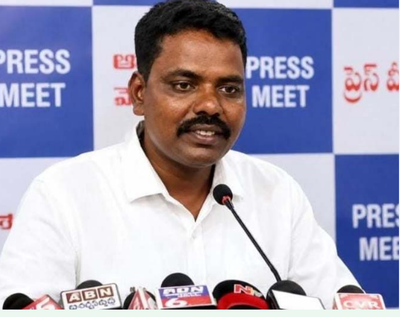
విద్యా కేంద్రాలుగా అభివృద్ధి చేయాలని గిరిజన సంక్షేమ సంఘం తరపున విజ్ఞప్తి చేశారు. ప్రజాధనంతో నిర్మించిన భవనాలు ప్రజలకే ఉపయోగపడేలా చర్యలు తీసుకోవడం ప్రభుత్వ బాధ్యత అని, ఈ నిర్ణయం ఇతర వెనుకబడిన ప్రాంతాలకు కూడా ఆదర్శంగా నిలుస్తుందని పేర్కొన్నారు