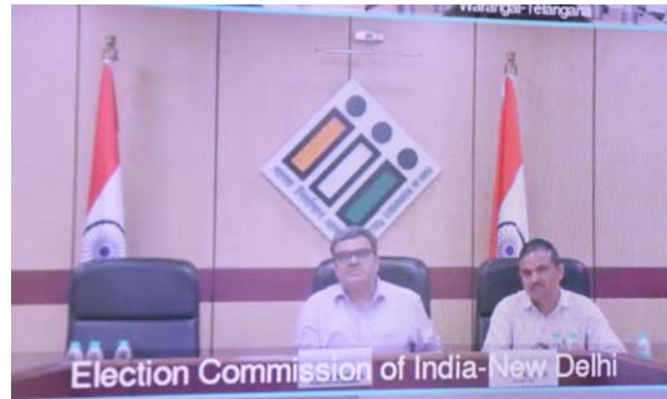
సంగారెడ్డి ప్రజా జ్యోతి జూలై 10:-