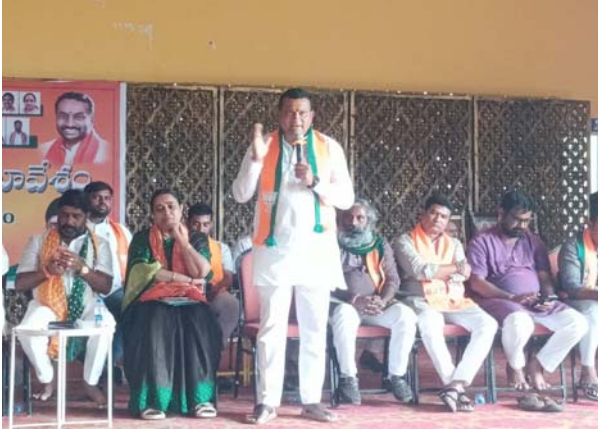
తెలంగాణలో కమలం జెండా ఎగరడం ఖాయం