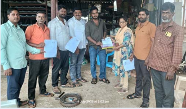
రాయికోడ్ జూలై 4 (ప్రజా జ్యోతి):

ఎన్నికల సంఘం ఆదేశాల మేరకు ఓటరు జాబితా ప్రత్యేక సవరణ కార్యక్రమం (ఎస్ఐఆర్)లో భాగంగా బూత్ లెవల్ అధికారులు ( బిఎల్ఓ) ఇంటింటికి వెళ్లి ఎస్ఐఆర్ ఫారమ్ల పంపిణీ చేపట్టారు. అర్జునైన ఓటర్లకు ఫారమ్లను అందజేస్తూ, వాటిని సక్రమంగా పూరించి అవసరమైన ధ్రువపత్రాలతో నిర్ణీత గడువులోగా సమర్పించాలని అవగాహన కల్పించారు. ఓటరు జాబితాలో కొత్త పేర్ల నమోదు, వివరాల సవరణ, చిరునామా మార్పు, పేర్ల తొలగింపు వంటి అంశాలకు సంబంధించిన ఫారమ్లను ప్రజలకు అందజేశారు. ఈ సందర్భంగా అధికారులు మాట్లాడుతూ.. ప్రతి అర్జునైన పౌరుడు తన ఓటరు వివరాలను సరిచేసుకుని ప్రజాస్వామ్య ప్రక్రియలో భాగస్వామి కావాలని సూచించారు. ప్రజలు బీఎల్వోలతో సహకరించి ఎస్ఐఆర్ ప్రక్రియను విజయవంతం చేయాలని కోరారు.