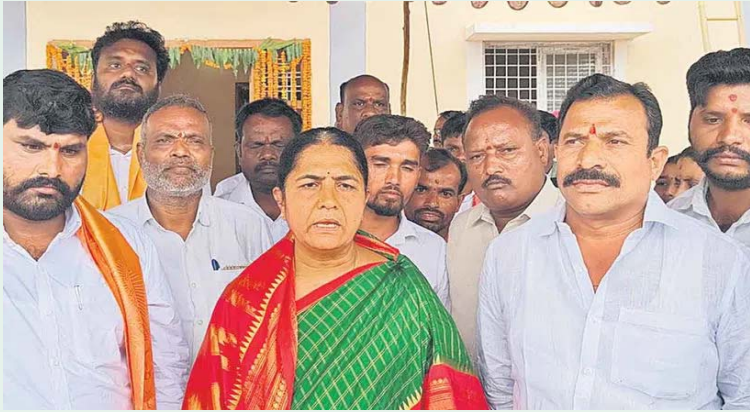
కొల్వారం, జూలై 1:

దుకాణాల్లో ఎరువులు అందుబాటులో ఉంచాలి ముఖ్యమంత్రి మాటలు తెలంగాణకు అవమానం ప్రభుత్వంపై మండిపడ్డ ఎమ్మెల్యే సునీతాలక్ష్మారెడ్డి