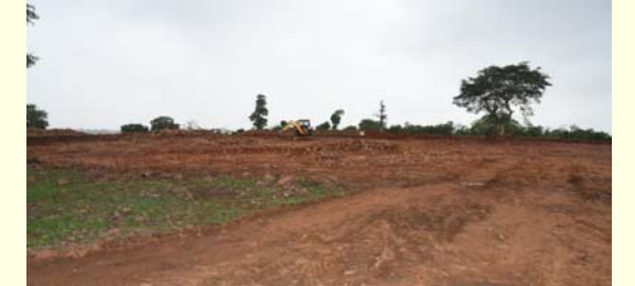
అదిలాబాద్ బ్యూరో, జూలై 3 (ప్రజా జ్యోతి) ఉత్పూర్ మండలం కుమ్మరి