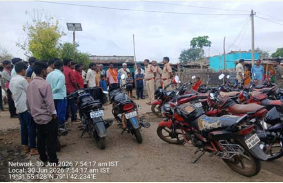
అవగాహన కల్పించారు. అక్రమ మద్యం నిల్వ, తయారీకి సంబంధించి కేసులు నమోదు చేసి దర్యాప్తు కొనసాగిస్తున్నట్లు పోలీసులు తెలిపారు.