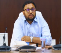
సూర్యాపేట జిల్లా ప్రతినిధి జూలై 08(ప్రజాజ్యోతి):