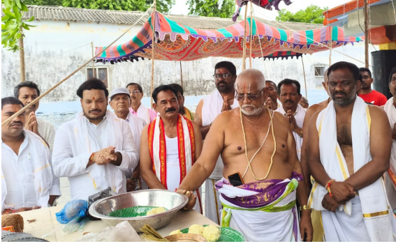
రామన్నపేట జూలై 4 ప్రజా జ్యోతి:

రామన్నపేట/ యాదాద్రి భువనగిరి : యాదాద్రి భువనగిరి జిల్లా రామన్నపేట మండల కేంద్రంలోని పాత బస్టాండ్ ఆవరణలో ఉన్న శ్రీ భూసీలా సమేత చెన్నకేశవ స్వామి ఆలయ వార్షిక బ్రహ్మోత్సవాలు శనివారం ప్రారంభమయ్యాయి. చెన్నకేశవస్వామి బ్రహ్మోత్సవాలను పురస్కరించుకుని శనివారంనాడు వేద పండితులతో విశ్వకసేన పూజ, పుణ్యవచనం, పంచనూక్త హోమ ములు, చండీ యాగం ఘనంగా నిర్వహించారు. అనంతరం భక్తులకు మహా అన్నప్రసాద వితరణ కార్యక్రమాన్ని