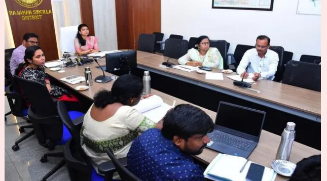
సిసిల్ల అర్చన, జూలై 4

వీడియో కాన్ఫరెన్స్ లో రాష్ట్ర ప్రభుత్వ ప్రధాన కార్యదర్శి సంజయ్ జూజు