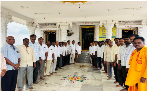
కొండమల్లేపల్లి, జూలై 4 (ప్రజాజ్యోతి):