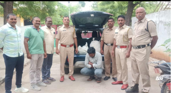
మతంపల్లి జూలై 3 (ప్రజా జ్యోతి):

అక్రమ పటిక రవాణాపై ఎక్స్ ప్రెజ్ శాఖ ఉక్కుపాదం ఒకరు అరెస్ట్, మరో నిందితుడు పరారీ