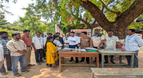
కోదాడ టౌన్, జూలై 10 ( ప్రజా జ్యోతి):

నాణ్యమైన బోధన, ఎస్ఎస్సీ అద్భుత ఫలితాలు, డిజిటల్--ఏఐ విద్యతో తల్లిదండ్రుల తొలి ఎంపికగా ప్రభుత్వ పాఠశాల