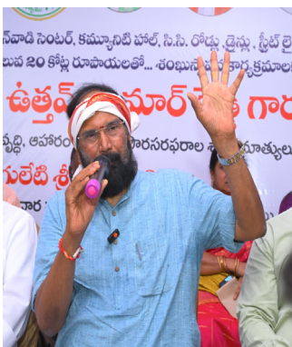
విద్యాభ్యాసం ఉంటుందని, మిగతా 10 కోట్లతో అంగన్ వాడి భవనం, కమ్యూనిటీ హాల్, సిసి రోడ్లు, డ్రైన్స్ , వీధి లైట్లు, పిల్లల ఆట స్థలం, షాపింగ్ కాంప్లెక్స్, ఆర్ట్ నిర్మాణాలు చేపట్టడం జరుగుతుందని మంత్రి అన్నారు. కాలనీలో ఇంకా గ్రీనరీ పెంచాలని అలాగే జిల్లాలోని హాసింగ్