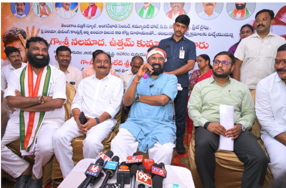
హుజూర్ నగర్ జూలై 10 (ప్రజా జ్యోతి):