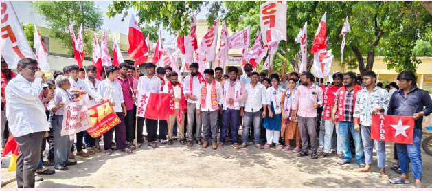
మిర్యాలగూడ, జూలై 10, ( ప్రజాజ్యోతి ):

- తక్షణమే విద్య హక్కు చట్టం అమలు చేయాలని డిమాండ్