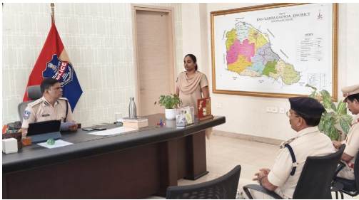
6, చీలింగ్కు సంబంధించినది ఒకటి,కుటుంబ వివాదానికి సంబంధించినది ఒకటి,ఇతర సమస్యలకు సంబంధించినవి 4 ఉండగా,మొత్తం 20 ఫిర్యాదులు సమారయ్యాయి.

జోగులాంబ గద్వాల జిల్లా పోలీసు కార్యాలయంలో సోమవారం నిర్వహించిన ప్రజావాణి కార్యక్రమంలో జిల్లాలోని పలు మండలాల నుంచి వచ్చిన 20 ఫిర్యాదులను జిల్లా ఎస్పీ డి.శ్రీనివాసరావు,స్వయంగా స్వీకరించారు.ఈ సందర్భంగా బాధితులతో నేరుగా మాట్లాడిన ఎస్పీ ప్రతి ఫిర్యాదును శ్రద్ధగా పరిశీలించి,సంబంధిత పోలీసు స్టేషన్ల అధికారులతో తక్షణమే సంప్రదించి చట్టపరమైన చర్యలను వేగవంతం చేయాలని ఆదేశించారు.బాధితులకు ఆలస్యం లేకుండా న్యాయం జరిగేలా నిరంతరం పర్యవేక్షణ కొనసాగిస్తామని తెలిపారు.భూ వివాదాలు,అస్తి తగాదాలు,కుటుంబ కలహాలు తదితర అంశాల్లో చట్టపరంగా పరిష్కారం చూపేందుకు చర్యలు తీసుకుంటామని స్పష్టం చేశారు.ప్రజావాణి ద్వారా వచ్చిన ఫిర్యాదుల పరిష్కారాన్ని ఎప్పటికప్పుడు సమీక్షిస్తూ ప్రజలకు పారదర్శకమైన, వేగవంతమైన సేవలు అందించడమే తమ లక్ష్యమని పేర్కొన్నారు.ఈ సందర్భంగా అందిన ఫిర్యాదుల్లో భూ వివాదాలకు సంబంధించినవి 8,గౌడవలకు సంబంధించినవి