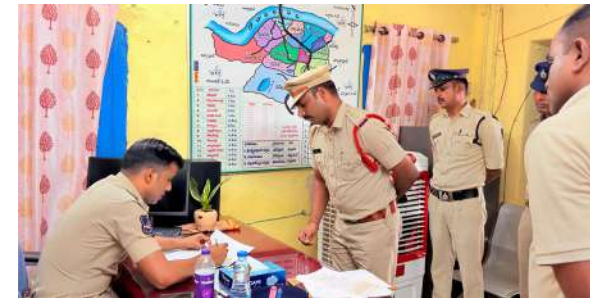
జీర్ పూర్, జూలై 8 (ప్రజాజ్యోతి): జిల్లాలో చోరీలు, గంజాయి విక్రయాలు, అక్రమ రవాణా లాంటి అసాంఘిక కార్యకలాపాలపై కఠిన నిఘా కొనసాగించాలని జిల్లా ఎస్పీ అశోక్ కుమార్ ఐపీఎస్ పోలీసు అధికారులను ఆదేశించారు. జిల్లాలోని పోలీస్ స్టేషన్ల పనితీరు, నేరాల దర్యాప్తు పురోగతి, ప్రజలకు అందిస్తున్న సేవలను పరిశీలించే

జీర్ పూర్ పోలీస్ స్టేషన్ ను ఆకస్మికంగా తనిఖి చేసిన ఎస్పీ కేసుల దర్యాప్తు పురోగతి, రికార్డుల పరిశీలన ప్రజా ఫిర్యాదులపై తక్షణమే స్పందించాలని ఆదేశం