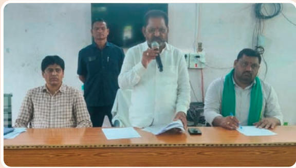
కార్యాలయంలో అన్ని శాఖల అధికారులతో వర్షాకాల సన్నద్ధతపై సమీక్ష సమావేశం నిర్వహించారు. ఈ సందర్భంగా