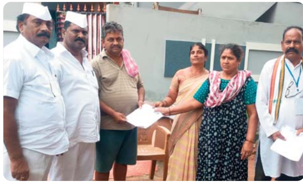
ప్రజాస్వామ్యానికి మూలస్తంభమని, రాజకీయాలకు అతీతంగా ప్రతి అర్హుడి

పేరు ఓటరు జాబితాలో నమోదు కావాల్సిన బాధ్యత సమాజంలోని ప్రతి ఒక్కరిపై ఉండవచ్చు. ఓటరు వివరాల ధృవీకరణ, కుటుంబ వివరాల అనుసంధానం, ముసాయిదా ఓటరు జాబితా పరిశీలన, క్వెయిమ్స్, అభ్యంతరాల దాఖలు వంటి అంశాలపై ప్రజలకు సమగ్ర సమాచారాన్ని అందించారు. కుటుంబంలోని అర్హులైన ప్రతి ఒక్కరి పేరు ఓటరు జాబితాలో నమోదై ఉండో లేదో తప్పనిసరిగా పరిశీలించుకోవాలని సూచించారు. ఓటరు వివరాలలో ఏదైనా పొరపాట్లు లేదా లోపాలు ఉంటే వెంటనే సంబంధిత అధికారులను సంప్రదించి సరిదిద్దుకోవాలని, నిర్దేశిత గడువులో అవసరమైన దరఖాస్తులను సమర్పించాలని కోరారు. ప్రజాస్వామ్యంలో ఓటు హక్కు అత్యంత విలువైనదని, 18 సంవత్సరాలు నిండిన ప్రతి అర్హుడి పేరు ఓటరు జాబితాలో ఉండేలా ప్రతి ఒక్కరూ బాధ్యతాయుతంగా వ్యవహరించాలని ఎస్.జె.కె. అహ్మద్ పిలుపునిచ్చారు.