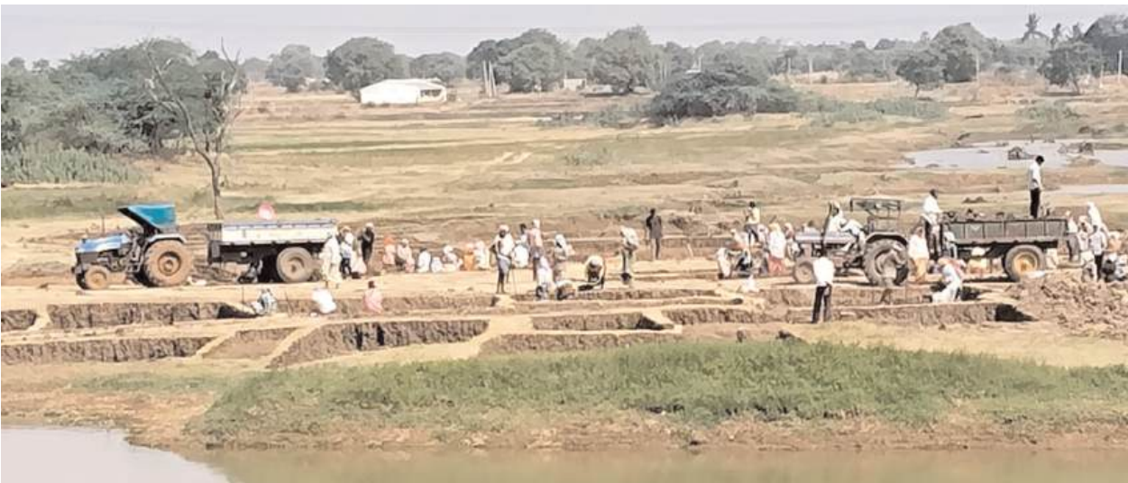
జాతీయ ఉపాధి హామీ పథకం..