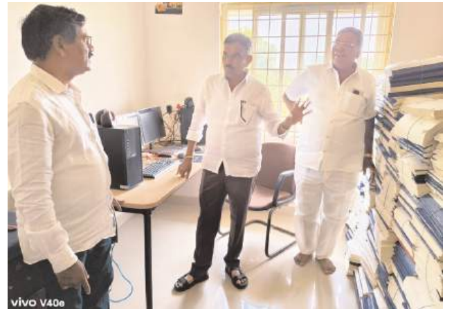
వార్డ్ మెంబర్లు, గ్రామ ఇందిరమ్మ కమిటీ, కాంగ్రెస్ పార్టీ నాయకులు పాల్గొన్నారు