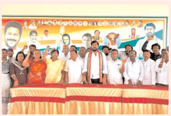
బీజేపీ ప్రజాస్వామ్యాన్ని ఖూనీ చేస్తోంది