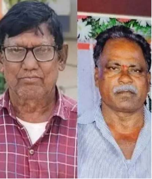
గాయంగా, ప్రతి కన్నీటి బొట్టులో చిరస్థాయిగా నిలిచిపోయింది. ఒకే కంచంలో తిన్న దోస్తులు... ఒకే అంబులెన్స్లో చివరి ప్రయాణం చేశారు... అనే మాట ఇప్పుడు గ్రామం మొత్తం గుండెల్ని పిండేస్తోంది.