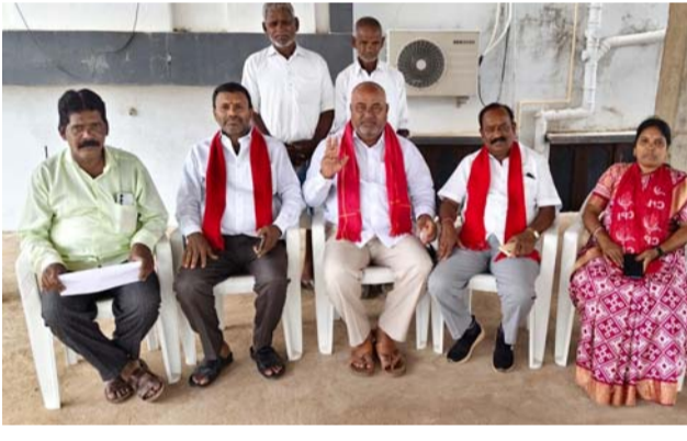
అనుకూలంగా వ్యవహరిస్తోందని ఆరోపించారు. ధరల పెరుగుదలతో పేద, మధ్యతరగతి కుటుంబాల ఆర్థిక పరిస్థితి దెబ్బతింటోందని, ప్రజల కానుకగా శక్తి రోజురోజుకూ