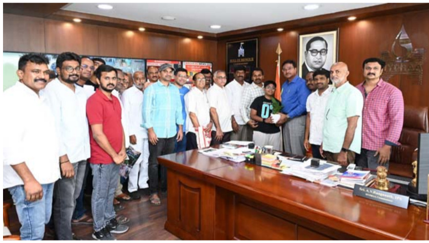
నివాసితులు హార్షం వ్యక్తం చేశారు. ముప్పిన్ చెరువు ఎస్టీఎల్ నిర్ధారించి ఆ మేరకు ఫెన్సింగ్ చేయడం.. హైద్రా అధికారుల పనితీరుకు నిదర్శనమన్నారు.