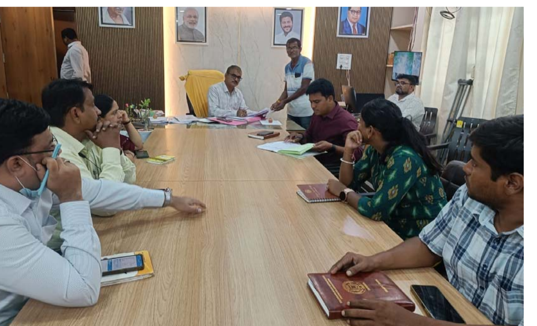
ప్రజావాణి మంచి అవకాశమని, ఈ వేదికను సద్వినియోగం చేసుకోవాలని ఆర్డీఓ సూచించారు. కార్యక్రమంలో వివిధ శాఖల అధికారులు, సిబ్బంది పాల్గొన్నారు.

- ఆర్డీఓ పార్లమెంటులో - ప్రజావాణిలో 12 ఫిర్యాదుల స్వీకరణ చేవెళ్ల, జూన్ 15 (ప్రజా జ్యోతి): ప్రజల సమస్యల పరిష్కారానికి ప్రజావాణి వేదికగా నిలుస్తుందని చేవెళ్ల ఆర్డీఓ పార్లమెంటులో తెలిపారు. ప్రజల నుంచి వచ్చే ప్రతి ఫిర్యాదును అధికారులు బాధ్యతగా స్వీకరించి, త్వరితగతిన పరిష్కరించేలా చర్యలు తీసుకోవాలని సూచించారు. సోమవారం చేవెళ్ల డివిజన్ కార్యాలయంలో ఆర్డీఓ అధ్యక్షతన నిర్వహించిన ప్రజావాణి కార్యక్రమంలో ప్రజల నుంచి ఫిర్యాదులు స్వీకరించారు. ఉదయం 10 గంటల నుంచి నిర్వహించిన కార్యక్రమంలో మొత్తం 12 ఆర్డీఓలు అందినట్లు ఆర్డీఓ తెలిపారు. అందిన ఫిర్యాదుల్లో రెవెన్యూ శాఖకు సంబంధించినవి 3, పింఛన్లకు సంబంధించినవి 9 ఉన్నాయని పేర్కొన్నారు. ఈ సందర్భంగా ఆర్డీఓ మాట్లాడుతూ.. ప్రజావాణిలో వచ్చిన సమస్యలను సంబంధిత అధికారులు క్షేత్రస్థాయిలో పరిశీలించి, నిబంధనల ప్రకారం వెంటనే పరిష్కరించాలని ఆదేశించారు. ప్రజలు తమ సమస్యలను నేరుగా అధికారుల దృష్టికి తీసుకువచ్చేందుకు