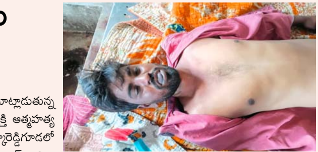
ఆత్మహత్య చేసుకున్నట్లు తెలిపారు. ఘటనపై చేవెళ్ల పోలీసులు కేసు నమోదు చేసి దర్యాప్తు చేపట్టారు