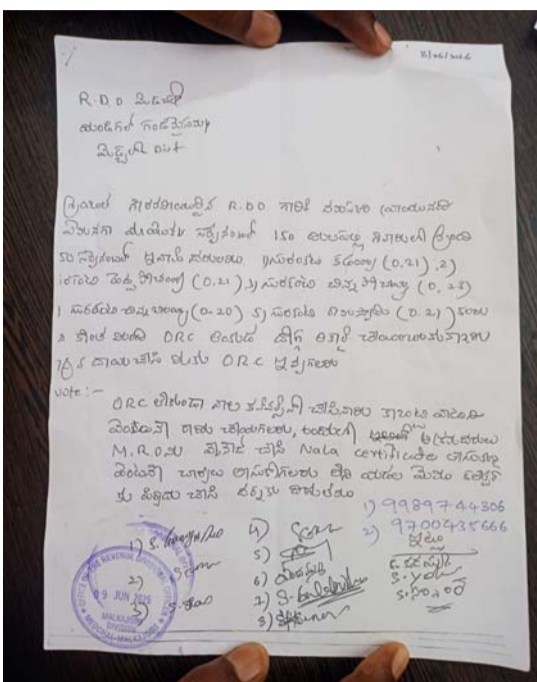
భూములకు స్వచ్ఛమైన యాజమాన్య ద్రువీకరణ (రాజ/జట్టా) లేనిదే కన్వర్షన్ ఇవ్వడం చట్టవిరుద్ధం. ఒకవేళ పొరపాటున

కొంపల్లి జూన్ 9 ప్రజా జ్యోతి:- దూలపల్లి డివిజన్ పరిధిలోని రెవెన్యూ నిబంధనలను కొందరు అధికారులు నిలుపునాటుగా తొక్కారు. ఇనాం లేదా అసైన్డ్ భూములకు అత్యంత కీలకమైన ఓఆర్పీ (రాష్ట్రవిజ్ఞానామిక ప్రకటన) లేకుండానే, నిబంధనలకు విరుద్ధంగా వ్యవసాయేతర భూమిగా మార్చి (చీరాలూ జతజాబ్ తీసుకోవడం) చేస్తూ పచ్చజెండా ఊపేశారు. లక్షల రూపాయల విలువైన ప్రభుత్వ ప్రయోజనాలకు గురికొంటూ, రియల్టర్లు లబ్ధి చేకూర్చేలా జరిగిన ఈ వ్యవహారం ఇప్పుడు స్థానికంగా తీవ్ర సంఘటనగా మారింది. అసలు ఏం జరిగింది? విశ్లేషణ చేసిన సమాచారం ప్రకారం... స్థానిక మండల గ్రామీణులు దూలపల్లి డివిజన్ పరిధిలో ఉన్న సర్వే నంబర్ 150 లోని సుమారు ఎకరాల భూమికి నాలా కన్వర్షన్ మంజూరైంది. నిబంధనల ప్రకారం ఇనాం భూములు లేదా ప్రభుత్వ శరతులు గల భూములను కమర్షియల్, వెంచర్ల పరంగా మార్చుకోవాలంటే 'ఓఆర్పీ' కావాలి. కానీ, సడరు భూమికి ఎలాంటి యాజమాన్య హక్కుల ప్రకారం (రాజ) లేదని తేలింది. రికార్డులు అసంపూర్ణంగా ఉన్నప్పటికీ, కేవలం కొద్దిరోజుల్లోనే ఈ షేల్ క్లియర్ కావడం వెనుక భారీ హస్తం ఉందనే ఆరోపణలు వెల్లువెత్తుతున్నాయి. నిబంధనలు ఏం చెబుతున్నాయి? తెలంగాణ/భూ మార్చి చట్టం (చీరాలూ జాబ్) ప్రకారం... వివాదాస్పద భూములు, ప్రభుత్వ లేదా అసైన్డ్