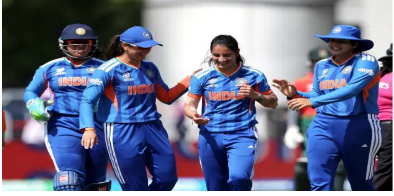
ఒలింపిక్స్లో క్రికెట్ పోటీలను ఆరు జట్లతో నిర్వహించనున్నారు.

ఇంటర్నెట్ డెస్క్: డిసెంబర్ 2026లో గ్రూప్ దశలోనే టోర్నీ నుంచి నిష్క్రమించి బాధలో ఉన్న భారత మహిళల క్రికెట్ జట్టుకు గుడ్ న్యూస్. 2028 ఒలింపిక్స్కు హార్ట్లెస్ట్ సేన అర్హత సాధించింది. ఈ మేరకు ఐసీసీ, అంతర్జాతీయ ఒలింపిక్ కమిటీ (ఐఓసీ) ప్రవేశపెట్టాయి. ప్రస్తుతం జరుగుతున్న మహిళల డి20 ప్రపంచ కప్లో టీమిండియా సెమీ ఫైనల్స్కు చేరుకోలేకపోయింది. అయితే, ఈ టోర్నీలో ఆసియా తరపున భారత్ అత్యుత్తమ ప్రదర్శన చేసింది. దీంతో భారత జట్టు ఒలింపిక్ టెస్టును ఖాయం చేసుకుంది. ఆస్ట్రేలియా, ఇంగ్లాండ్, సౌతాఫ్రికా కూడా క్వాలిఫై అయ్యాయి. అమెరికాలోని లాస్ ఏంజెలెస్ వేదికగా 2028 ఒలింపిక్ గేమ్స్ జరగనున్నాయి. 1900లో ఒక్కసారి మాత్రమే ఒలింపిక్స్లో భాగమైన క్రికెట్.. 2028లో పునరాగమనం చేయబోతున్న సంగతి తెలిసిందే. లాస్ ఏంజెలెస్