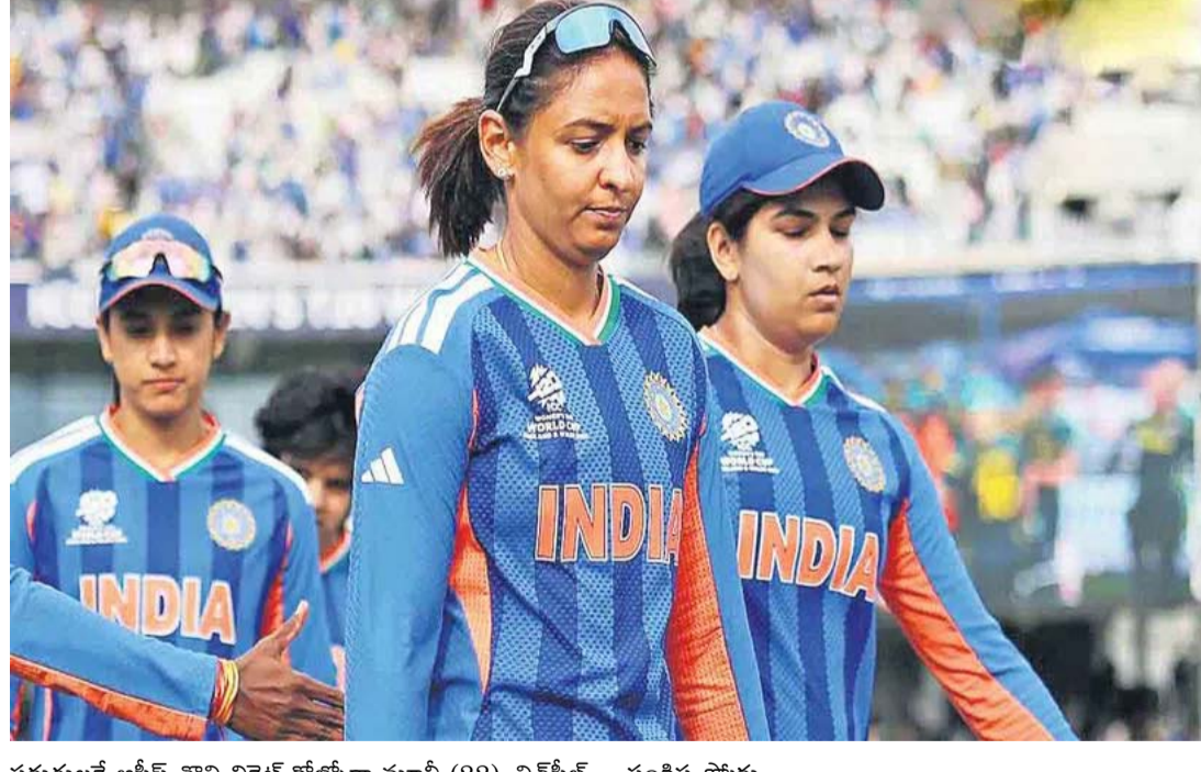
పరుగులకే ఆసీస్ తొలి వికెట్ కోల్పోగా మూసీ (22), లిచోఫీల్డ్ (24) నిలకడగా ఆడి ఆ జట్టును పోటీలోకి తెచ్చారు. ఈ ఇద్దరి నిష్క్రమణ తర్వాత వచ్చిన పెర్రీ, ఆష్లీ భారత్ కు ఎలాంటి అవకాశం ఇవ్వకుండా పనిపూర్వకేసారు. ఈ జోడీ నాలుగో వికెట్ కు 57 బంతుల్లోనే వంద పరుగులు జోడించి భారత్ కు విజయాన్ని దూరం చేశారు.

ఆస్ట్రేలియా చేతిలో ఓటమి లండన్ : మహిళల టీ20 ప్రపంచకప్ లో భారత్ అమ్మాయిల కథ ముగిసింది. సెమీస్ చేరాలంటే తప్పక గెలవాల్సిన పోరులో టీమిండియా.. 6 వికెట్ల తేడాతో ఆస్ట్రేలియా చేతిలో ఓడి గ్రూప్ దశలోనే ఇంటిబాట పట్టింది. భారత్ నిర్దేశించిన 171 పరుగుల లక్ష్యాన్ని కంగారూలు.. 19 ఓవర్లలో 4 వికెట్లు మాత్రమే కోల్పోయి ఛేదించారు. ఎలీస్ పెర్రీ (38 బంతుల్లో 56, 8 ఫోర్లు), ఆల్ రౌండర్ ఆష్లీ గార్నర్ (29 బంతుల్లో 53 నాటౌట్, 3 ఫోర్లు, 3 సిక్స్లు) ధనాధన మెరుపులతో టీ20 ప్రపంచకప్ లో ఉమెన్ ఇన్ బ్లాక్ నిరాశ తప్పలేదు. బౌలింగ్ వైఫల్యంతో భారత్ భారీ మూల్యం చెల్లించుకుంది. అంతకుముందు కెప్టెన్ హర్మన్ ప్రీత్ కౌర్ (27 బంతుల్లో 56, 6 ఫోర్లు, 3 సిక్స్లు) అద్భుతకానికి తోడు స్పృతి మంధాస (38), షెఫాలీ వర్మ (34), జెమీమా రోడ్రిగ్స్ (34) రాణించడంతో భారత్.. నిర్ణీత ఓవర్లలో 170/4 పరుగులు చేసింది. ఈ ఓటమితో భారత్ టోర్నీ నుంచి నిష్క్రమించగా గ్రూప్-ఏ నుంచి ఆస్ట్రేలియా (10 పాయింట్లు), దక్షిణాఫ్రికా (8 పాయింట్లు) సెమీస్ కు దూసుకెళ్లాయి. అంతకుముందు సఫారీ జట్టు.. 4 వికెట్ల తేడాతో బంగ్లాదేశ్ ను ఓడించి సెమీస్ మార్గాన్ని సుగమం చేసుకుంది.