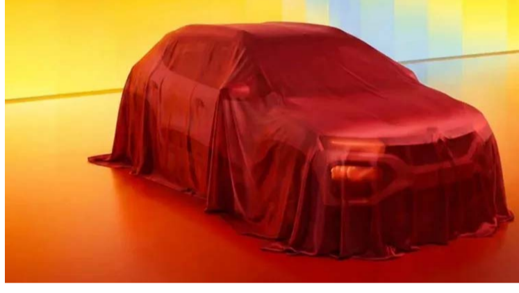
అనుభవాన్ని మెరుగుపరచడానికి క్విడ్ ఫేస్లిష్ట్ కొన్ని చిన్న అప్డేట్లను పొందుతుందని సమాచారం. అధికారిక ఫీచర్ల జాబితా ఏదీ వెల్లడించనప్పటికీ, అప్డేట్ మోడల్ లో పెద్ద టచ్ స్క్రీన్ ఇన్ఫోటైమ్ మెంట్ సిస్టమ్, ఫుల్ డిజిటల్ ఇన్స్ట్రుమెంట్ క్లస్టర్ లభించే అవకాశం ఉంది. ఇంజిన్

రెనాల్డ్ తన ఎంట్రీ-లెవల్ హ్యూస్ బ్యాక్ అయిన అప్డేటెడ్ క్విడ్ ఫేస్లిష్ట్ ను జూలై 3న భారతదేశంలో విడుదల చేయనుంది. దశాబ్దానికి పైగా దేశంలో అమ్ముడవుతున్న క్విడ్ కారు కంపెనీకి చెందిన పాపులర్ మోడల్ గా కొనుగోలు, దాని లైసెన్స్ కీలక పాత్ర పోషిస్తుంది. క్విడ్ ఫేస్లిష్ట్ కారుకు సంబంధించిన వివరాలను కంపెనీ అధికారికంగా వెల్లడించలేదు. అయితే.. ఇటీవల టెస్టింగ్ సమయంలో కనిపించిన సై షాట్లు ఫేస్లిష్ట్ క్విడ్ పూర్తిస్థాయి రీడిజైన్ కు బదులుగా సూక్ష్మమైన సైలింగ్ మార్పులను పొందుతుందని సూచిస్తున్నాయి. వెహికల్ ముందు భాగం, రెనాల్డ్ బ్యాడ్జ్, టెయిల్ ల్యాంప్ల చుట్టూ క్యామోఫ్లాజ్ తో కనిపించాయి. కాబట్టి ఇది కీలకమైన విజువల్ ఎలిమెంట్స్ లో అప్డేట్ లను సూచిస్తుంది. అప్డేట్ మోడల్ లో కొత్త గ్రీల్, బంపర్లు, కొత్త లైటింగ్ అంశాలు ఉంటాయని భావిస్తున్నారు. ఈ డిజైన్ దానియా స్ట్రాంగ్ ఈవీ నుంచి ప్రేరణ పొందవచ్చని, తద్వారా క్విడ్ ను.. రెనాల్డ్ అభివృద్ధి చెందుతున్న గ్లోబల్ డిజైన్ లాంగ్వేజ్ కు అనుగుణంగా మార్పువచ్చని కూడా నివేదికలు సూచిస్తున్నాయి. లోపలి భాగంలో.. మొత్తం క్యాబిన్