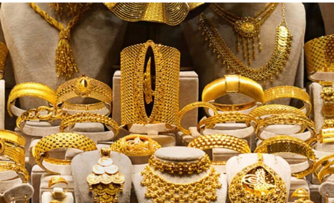
మార్కెట్ పై నియంత్రణ సాధించాలని భావించారు. అనుకున్న చూపించినది తెలుస్తోంది. విధంగా.. ఈ నిర్ణయం వినియోగదారులపై తక్షణ ప్రభావం

భారతదేశంలో ఇటీవల బంగారం, వెండి ధరలు గణనీయంగా తగ్గాయి. ప్రధానమంత్రి నరేంద్ర మోదీ.. పౌరులను ఒక సంవత్సరం పాటు బంగారం కొనుగోళ్లను వాయిదా వేయాలని చేసిన సూచన తర్వాత ఈ మార్పు చోటుచేసుకుందని నిపుణులు చెబుతున్నారు. మే 10న ప్రధానమంత్రి బంగారం కొనుగోళ్లను ఒక ఏడాది వాయిదా వేయాలని చెప్పినప్పుడు, 24 క్యారెట్ బంగారం ధర 10 గ్రాములకు సుమారు రూ.1,53,140గా ఉండగా, వెండి ధర కేజీ సుమారు రూ.2,62,350గా ఉంది. అయితే నేటికి (జూన్ 28) ఆ ధర బంగారం ధర రూ.1,39,873కి తగ్గగా, వెండి ధర రూ.2,16,541కి పడిపోయింది. అంటే.. మోదీ ప్రకటన తరువాత గోల్డ్ రేటు సుమారు రూ.13,267 తగ్గగా, వెండి దాదాపు రూ.45,809 తగ్గింది. భారత్ లో బంగారం దిగుమతులు ఎక్కువగా ఉండటం వల్ల విదేశీ మారక ద్రవ్యంపై భారీ టిడ్డి పడుతోంది. ఈ పరిస్థితుల్లో విదేశీ మారక నిల్వలను కాపాడుకోవడానికి ప్రధాని మోదీ ప్రజలను ఉద్దేశించి అవసరం ఉంటే తప్ప.. బంగారం కొనుగోళ్లు, విదేశీ ప్రయాణాలను వాయిదా వేయాలని కోచారు. ప్రధాని విజ్ఞప్తి తరువాత ప్రభుత్వం బంగారం, వెండి దిగుమతి సుంకాన్ని 6 శాతం నుంచి 15 శాతానికి పెంచింది. దీని ద్వారా దిగుమతులను తగ్గించడంతో పాటు.. దేశీయ