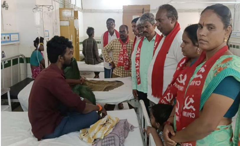
సిపిఎం నాయకుల డిమాండ్.