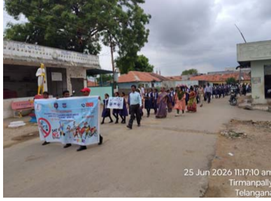
గమనించినట్లయితే వెంటనే పోలీసులకు సమాచారం అందించాలని, సమాచారం ఇచ్చిన వారి వివరాలు గోప్యంగా ఉంచబడతాయని తెలిపారు. ?గ్రామ ప్రజల నుండి విశేష స్పందన లభించిన ఈ కార్యక్రమం, చివరగా విద్యార్థులు, గ్రామస్థులందరితో కలిసి 'యాంట్ డ్రగ్ ప్రతిజ్ఞ' చేయించడంతో ముగిసింది. డ్రగ్స్ రహిత సమాజ నిర్మాణానికి ప్రతి ఒక్కరూ బాధ్యతగా వ్యవహరించాలని ఈ సందర్భంగా పిలుపునిచ్చారు. ?ఈ కార్యక్రమంలో పాఠశాల ప్రధానోపాధ్యాయులు, ఉపాధ్యాయ బృందం, పోలీస్ సిబ్బంది, గ్రామ ప్రజాప్రతినిధులు, మరియు గ్రామస్థులు పాల్గొన్నారు.

ఇందల్వాయి, జూన్ 25, ( ప్రజా జ్యోతి ) సమాజంలో మాదక ద్రవ్యాల నిర్మూలన మరియు డ్రగ్స్ వినియోగంపై ప్రజల్లో చైతన్యం కల్పించే లక్ష్యంతో ఇందల్వాయి మండలం తీర్మాన్ పల్లి గ్రామంలో భారీ యాంట్ డ్రగ్ అవగాహన ర్యాలీ నిర్వహించారు. స్థానిక జెడ్పీసీఎస్ పాఠశాల విద్యార్థులు, ఉపాధ్యాయులు, గ్రామస్థులు మరియు పోలీసు సిబ్బంది సంయుక్తంగా ఈ కార్యక్రమంలో పాల్గొన్నారు. ?ఈ సందర్భంగా ర్యాలీలో విద్యార్థులు అవగాహన ప్లకార్డులు ప్రదర్శిస్తూ, "డ్రగ్స్ కు నో చెప్పండి -- ఆరోగ్యకరమైన భవిష్యత్తును నిర్మించండి" అంటూ చేసిన నినాదాలు గ్రామ ప్రజలను ఆకట్టుకున్నాయి. మాదక ద్రవ్యాల వల్ల కలిగే ఆరోగ్య,