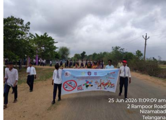
విద్యా, కుటుంబ మరియు సామాజిక దుష్ప్రభావాలపై ఈ సందర్భంగా ప్రజలకు వివరించారు.

పాల్గొన్నానూ విద్యార్థులు, ఉపాధ్యాయులు మరియు పోలీసు సిబ్బంది మాదకద్రవ్యాలకు దూరంగా ఉండాలని యువతకు పోలీసుల పిలుపు