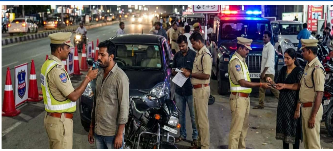
గుర్తింపు కార్డు, డ్రైవింగ్ లైసెన్స్ చూపితే వాహనాన్ని విడుదల చేస్తామని వెల్లడించారు. తెలంగాణ హైకోర్టు డబ్ల్యూపీ నెం.1647/2021, డబ్ల్యూపీ నెం.38805/2025 తీర్పులతో పాటు తెలంగాణ మోటార్ వెహికల్ రూల్స్-1989లోని రూల్ 448-ఏ ప్రకారమే ఈ విధానం అమలు చేస్తున్నట్లు ట్రాఫిక్ ఏసీపీ కార్యాలయం తెలిపింది. దీంతో డ్రంక్ అండ్ డ్రైవ్ కేసుల్లో వాహనాల జప్తుపై ప్రజలకు స్పష్టత లభించినట్లయింది.