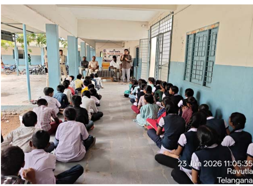
23 Jun 2026 11:05:35 Ravutla Telangana