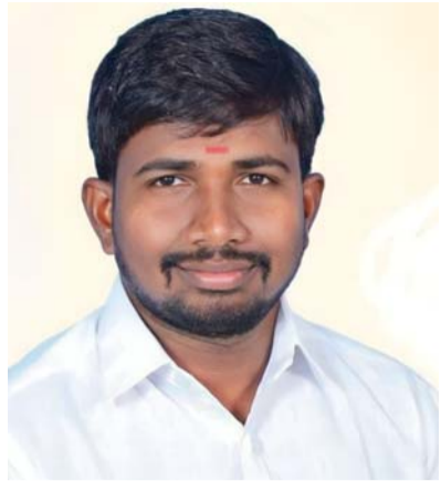
సమస్యను ప్రభుత్వం దృష్టికి తీసుకెళ్లి న్యాయమైన హక్కుల సాధన కోసం నిరంతరం కృషి చేయడం జరిగింది. ఈ