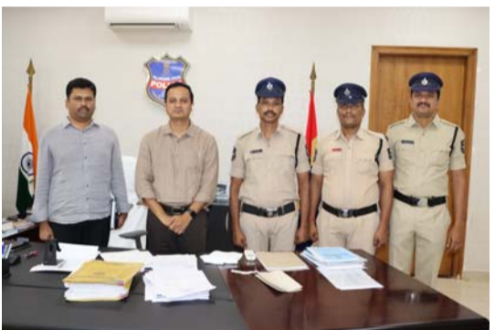
'అక్కడి నుంచి తోకమూడిచారు. లోపల చూస్తే ఒక మొబైల్ ఫోన్, రూ.2,500 క్యాష్ మాయమయ్యాయి. మైండ్ బ్లోయింగ్ 'కంట్రోల్ రూమ్' స్కెచ్.. కమాండ్ సెంటర్ అలర్ట్/ఇక్కడే అసలు సినిమా మొదలైంది. బాధితుడు కంగారు పడకుండా వెంటనే డయల్-100కు కాల్ చేసి, దొంగ పారిపోయేటప్పుడు వేసుకున్న బట్టల వివరాలను (డ్రెస్ కోడ్) పూసగుచ్చినట్లు చెప్పాడు. ఇక అంతే... కామారెడ్డి జిల్లా పోలీస్ కంట్రోల్ రూమ్ ఒక్కసారిగా యాక్షన్ మోడలోకి వచ్చింది. నిమిషాల వ్యవధిలో వైరెస్ సెట్లు గర్జించాయి. కంట్రోల్ రూమ్ సిబ్బంది పక్కా ప్లానింగ్తో అలర్ట్ మెసేజీలు జిల్లాలోని అన్ని పోలీస్ స్టేషన్లకు, నైట్ పెట్రోలింగ్ బృందాలకు, బ్లాక్ కోర్ట్ సిబ్బందికి చేరవేశారు. ముఖ్యంగా గ్రౌండ్ లెవల్లో ఉన్న 'ఆపరేషన్ కవచ్' డిమ్మి మొత్తాన్ని ఒక కంటిన్యూయస్ నిఘా వలయంగా మార్చేశారు. కంట్రోల్ రూమ్ స్ట్రాటజీ: దొంగ ఏ దారిలో వెళ్లితూ తప్పించుకోలేనంత పక్కాగా రూల్డ్ మ్యాన్ జియో-ఫెన్సింగ్ లాగా అల్లర్ల చేశారు. 'ఆపరేషన్ కవచ్' చెక్పోస్ట్ దగ్గర హై-వోల్టేజీ నిఘా!

'పోకిరి' స్ట్రీట్ల దొంగను పట్టుకున్న కామారెడ్డి పోలీసులు! ఆపరేషన్ కవచ్ పంజా.. గంటల్లోనే చోరీ కేసు ఛేదన - నిందితుడి అరెస్ట్, సాక్షి స్వాధీనం డయల్-100 అల్లర్ల... కంట్రోల్ రూమ్ కమాండ్.. పక్కా స్కెచ్తో దొంగను పట్టుకున్న కామారెడ్డి పోలీసులు నేరస్థులకు నిద్రలేకుండా చేస్తున్న 'ఆపరేషన్ కవచ్'.. గంటల వ్యవధిలోనే దొంగను కటకటాల వెనక్కి నెట్టిన పోలీసులు.