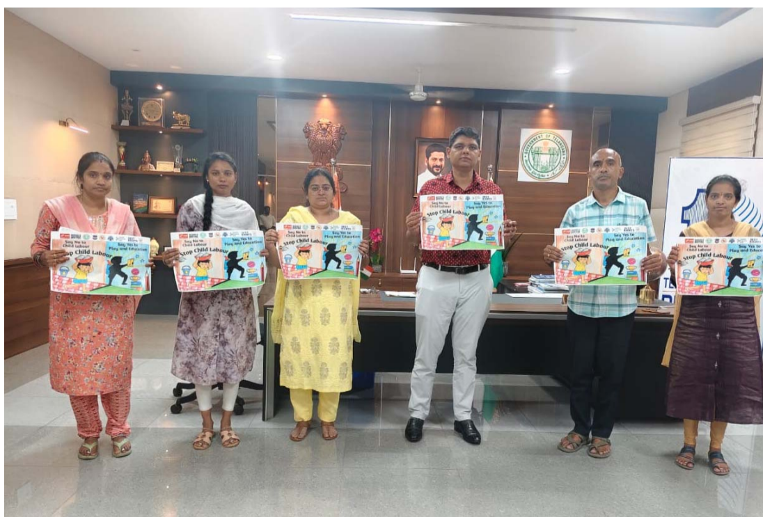
ఆదేశించారు. తల్లిదండ్రులు తమ పిల్లలను పనులకు పంపకుండా పాఠశాలకు పంపాలని, బాల కార్మికలు ఎక్కడైనా కనిపిస్తే సంబంధిత అధికారులకు సమాచారం అందించాలని ప్రజలను కోరారు. బాల కార్మిక వ్యవస్థ నిర్మూలనలో ప్రభుత్వంతో పాటు స్వచ్ఛంద సంస్థలు, విద్యాసంస్థలు, ప్రజా ప్రతినిధులు, పౌర సమాజం భాగస్వాములు కావాలని జిల్లా కలెక్టర్ పిలుపునిచ్చారు. "ప్రతి చిన్నారికి విద్య -- ప్రతి చిన్నారికి బాల్యం" అనే లక్ష్యంతో బాల కార్మిక రహిత సమాజ నిర్మాణానికి అందరూ కృషి చేయాలని జిల్లా కలెక్టర్ ఆశిష్ సాంగ్వాన్ కోరారు.

అనే లక్ష్యంతో బాల కార్మిక రహిత సమాజ నిర్మాణానికి అందరూ కృషి చేయాలి బాలకార్మిక నిర్మూలన పోస్టర్ ను ఆవిష్కరించిన జిల్లా కలెక్టర్ ఆశిష్ సాంగ్వాన్