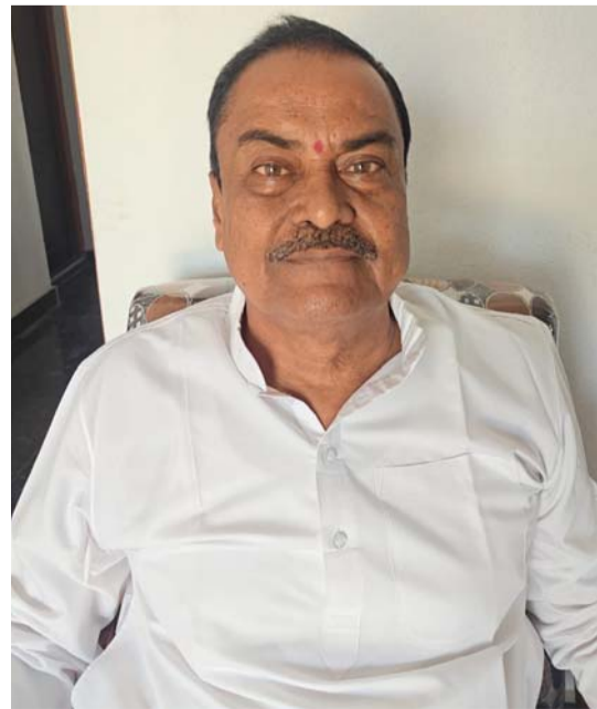
ఇన్వాలని డిమాండ్ చేశారు.

చేయలేదని ఆగ్రహం వ్యక్తం చేశారు.కొనుగోలు కేంద్రాల్లో సరైన ఏర్పాట్లు లేకపోవడం, తూకం ప్రక్రియలో జాప్యం,గన్నీ సంచల కొరత, చెల్లింపుల ఆలస్యం, అకాల వర్షాలతో చేతికి వచ్చిన పంట నీటి పాలవడం వంటి సమస్యలతో రైతులు తీవ్ర ఇబ్బందులు పడుతున్నారని మండిపడ్డారు. రైతు పండించిన ప్రతి గింజను ప్రభుత్వం వెంటనే కొనుగోలు చేయాలని బీఆర్ఎస్ పార్టీ తరఫున డిమాండ్ చేశారు.కొనుగోలు కేంద్రాల్లో ధాన్యాన్ని తక్కువే తరలింది రైతులకు న్యాయం చేయకపోతే రైతులతో కలిసి రోడ్లెక్కుతామని హెచ్చరించారు. రైతులు ఆందోళన చెందాల్సిన అవసరం లేదు. వారి సమస్యల పరిష్కారం కోసం బీఆర్ఎస్ పార్టీ ఎల్లప్పుడూ అండగా ఉంటానని భరోసా కల్పించారు.వానాకాలం పంటల సాగు కు రైతులు సిద్ధమవ్వాలని సమయం వచ్చిందని.. ఇప్పటికీ కూడా.. అటు ధాన్యం పోక, చేతిలో డబ్బులు లేక, విత్తనాలు ఎరువులు కొనలేక, చేసిన అప్పులు కట్టలేక రైతు నానా రకాలుగా అవస్థలు పడుతున్నాడు అన్నారు. రైతులు పరి వేయిద్దు పంటల మార్పిడి చేయాలంటూ, ఏ పంటలు వేయాలి, కచ్చితంగా పంటను కొనుగోలు చేస్తాం,మద్దతు ధర ఎంత ఇస్తామని ప్రభుత్వం నుంచి ఖచ్చితమైన హామీని