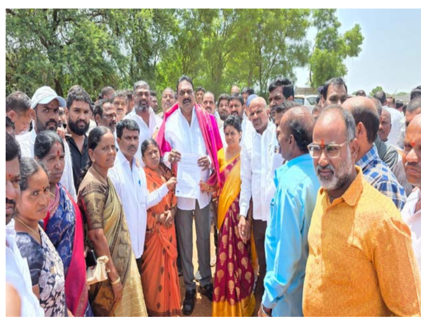
ఉన్నవలంగా భూమి తీసుకుంటే రోడ్డున పడతాం భూమికి భూమి ఇచ్చి భూమి స్వాధీనం చేసుకోవాలి -- చౌదరి గూడ రైతులు

తమకు న్యాయం చేయాలంటూ ఎమ్మెల్యే ప్రకాష్ గౌడ్ కు వినతిపత్రం అందించిన చౌదరిగూడ గ్రామ రైతులు అధికారులతో చర్చించి రైతులకు న్యాయం జరిగిలా చేస్తాం ఎమ్మెల్యే ప్రకాష్ గౌడ్ రాజేంద్రనగర్, జూన్ 19 (ప్రజా జ్యోతి) చౌదర్ గూడ గ్రామంలో గత 70 ఏళ్ల క్రితం అప్పటి కాంగ్రెస్ ప్రభుత్వం వ్యవసాయం చేసుకునేందుకు పేద ప్రజలకు భూములు పంచిందన్నారు. ఇప్పుడు అధికారులు వచ్చి మీ భూములు