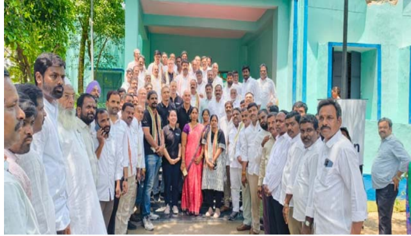
- చేవెళ్ల ఎమ్మెల్యే కాలి యాదయ్య

-గ్రంథాలయ సంస్థ చేర్చిన ఎలగాంటి మధుసూదన్ రెడ్డి