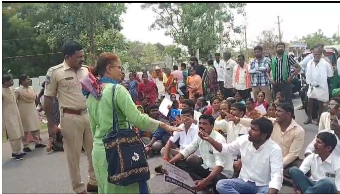
తాసిల్దార్ కార్యాలయం వద్ద ఫార్మా రైతుల ఆందోళన రైతుల భారీ రాస్తారోకో తహసీల్దార్ కార్యాలయం ముట్టడి సాగర్ రహదారిపై బైటాయింపు కట్టలు దాటిన ఆగ్రహం ఆక్రమ భూ సేకరణ నిలిపివేయాలని నినదించిన రైతులు కోటి రూపాయలు ఇచ్చిన భూములు ఇచ్చేది లేదు బలవంతంగా భూములు లాక్కోవడం అత్యంత దుర్భాగం కోర్టు స్టేసు ఉల్లంఘిస్తున్న అధికార యంత్రాంగం న్యాయం జరిగే వరకూ ఆందోళన కొనసాగిస్తాం

యాచారం, జూన్ 08 (ప్రజాజ్యోతి): హైకోర్టు స్టే ఆర్డర్ ను ఉల్లంఘిస్తూనే ప్రభుత్వ అధికారులు నిబంధనలకు విరుద్ధంగా ఫార్మాసిటీ భూసేకరణ వ్యవహారంలో బలవంత భూ సేకరణకు పాల్పడుతున్నారని ఫార్మా భూ బాధిత రైతులు మండిపడ్డారు. సోమవారం ఫార్మా భూబాధిత నాలుగు గ్రామాల రైతులు బక్కంగా నడుమిగించి అధికారుల తీరును వ్యతిరేకిస్తూ తహసీల్దార్ కార్యాలయం వద్ద నిరసన ఆందోళనకు దిగారు. ఆక్రమ భూ సేకరణను నిలిపివేయాలని, భూముల్లో ఆక్రమంగా కొనసాగిస్తున్న పనులు వెంటనే నిలిపివేయాలని, వద్దంటే మాక్కొద్దు పూర్వ సీటీ మాక్కొద్దు, వివేకవంతుల ఫార్మాసిటీ మాక్కొద్దు రైతులంతా గొంతు ఎత్తి నినదించారు. ష కార్డులు ప్రదర్శిస్తూనే అధికారుల ప్రభుత్వం మొండి వైఖరిని