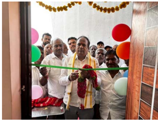
ఎమ్మెల్యే డా.ఆర్.భూపతి రెడ్డి పేర్కొన్నారు. మంగళవారం రూరల్ మండలం గుండాంబలో ఇందిరమ్మ ఇండ్ల

గుండాంబలో 39 ఇందిరమ్మ ఇండ్లు మంజూరు 26 గ్రౌండింగ్ పూర్తి.. 12 గృహప్రవేశాలు