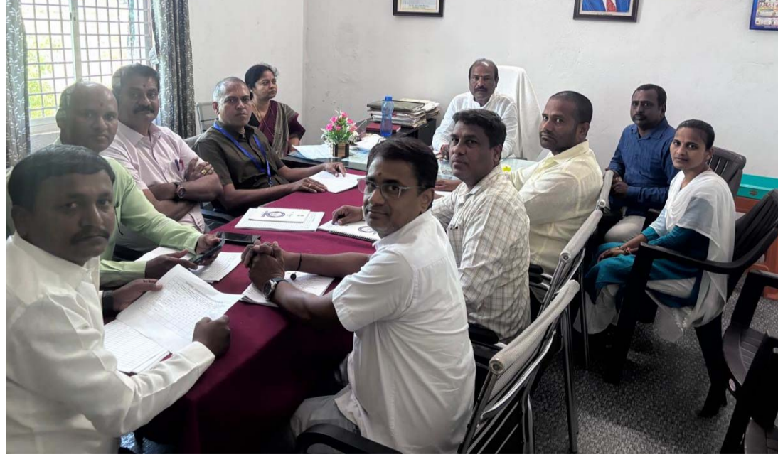
సూపర్వైజర్లు ఎనిమింటేటర్ల పాల్గొన్నారు