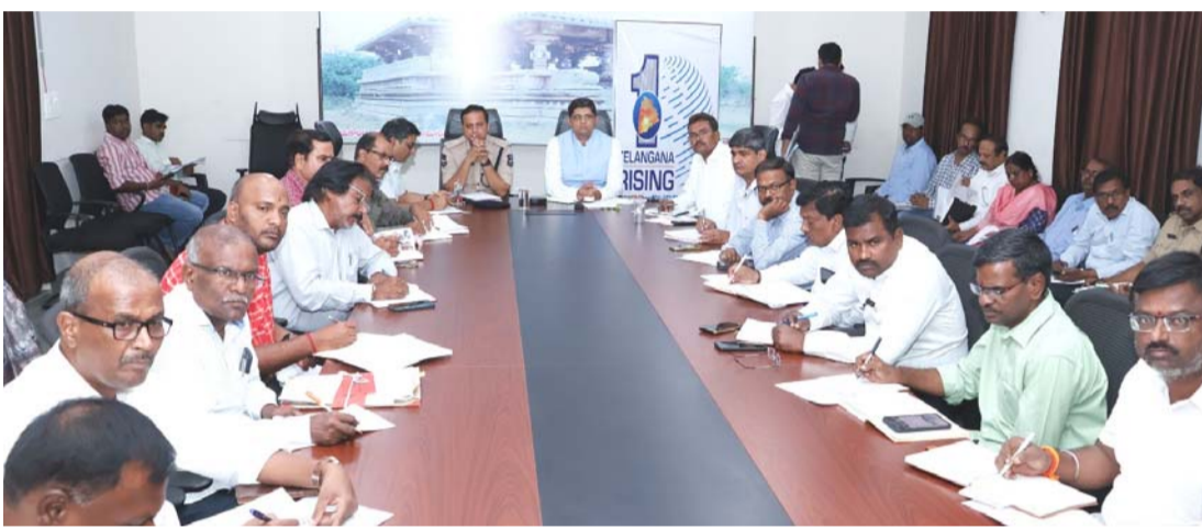
గ్రామీణాభివృద్ధి, మున్సిపల్, వివత్తు నిర్వహణ తదితర శాఖల అధికారులు పాల్గొన్నారు.