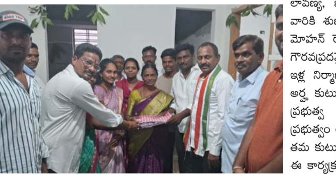
గృహప్రవేశ కార్యక్రమంలో ఆయన ముఖ్య అతిథిగా పాల్గొన్నారు. ఈ సందర్భంగా కర్ణల కుటుంబ సభ్యులు,