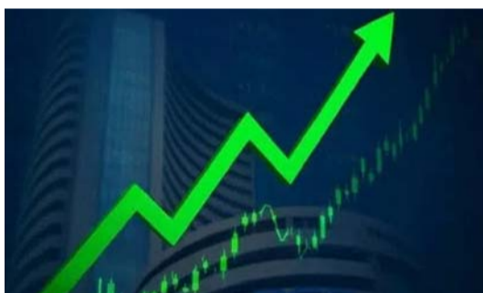
గెయినర్స్ గా నిలిచాయి. రంగాల వారిగా చూస్తే, నిస్సీ ఐటీ, నిస్సీ రియల్టీ సూచీలు రెండు శాతానికిపైగా లాభపడి మార్కెట్

దేశీయ స్టాక్ మార్కెట్ సూచీలు బుధవారం భారీ లాభాలతో ముగిశాయి. ముఖ్యంగా ఇన్ఫ్రాస్ట్రక్చర్ టెక్నాలజీ బ్యాంకింగ్ పైనాన్నియల్ రియల్టీ రంగాల షేర్లలో బలమైన కొనుగోళ్లు జరగడంతో మార్కెట్లు లాభాల బాట పట్టాయి. ట్రేడింగ్ ముగిసే సమయానికి, సెన్సెక్స్ 790.54 పాయింట్లు లాభపడి 76,991.22 వద్ద స్థిరపడింది. నిస్సీ (బీఐఎస్ఎ) 197.55 పాయింట్లు పెరిగి 24,021.65 వద్ద ముగిసింది. ట్రేడింగ్ సెషన్ ఆరంభం నుంచే మార్కెట్లో సానుకూల సెంటిమెంట్ కనిపించింది. కీలక రంగాల్లో ఇన్వెస్టర్లు షేర్లను కొనుగోలు చేయడంతో సూచీలు మంచి లాభాలను నమోదు చేశాయి. నిస్సీలో ఇంటర్నెట్ ఏవియేషన్, అదానీ ఎంటర్ప్రైజెస్, ట్రెంట్ షేర్లు అత్యధికంగా లాభపడి టాప్