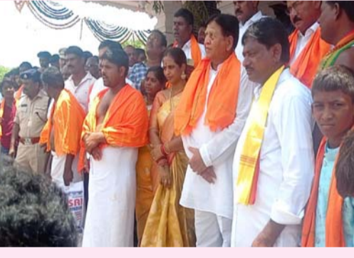
వెంకట్ నారాయణ గ్రామ కమిటీ సభ్యులు, గ్రామ పెద్దలు, కాంగ్రెస్ పార్టీ నాయకులు, కార్యకర్తలు, మహిళలు, యువకులు, భక్తులు పాల్గొన్నారు.