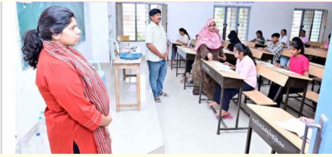
పరీక్షకు 86.55 శాతం మంది అభ్యర్థులు హాజరయ్యారు.. చేసిన నేపథ్యంలో ఎలాంటి లోటుపాట్లకు తావులేకుండా ప్రశాంత వాతావరణంలో, సజావుగా నీట్ పరీక్షలు జరిగాయని ఆమె వివరించారు.

నిజామాబాద్ ప్రజాజ్యోతి జూన్ 21 అదివారం జరిగిన 'నీట్' పరీక్ష విజయవంతంగా ముగిసింది. నగరంలోని గిరిరాజ్ ప్రభుత్వ డిగ్రీ కళాశాలలో ఏర్పాటు చేసిన పరీక్షా కేంద్రాన్ని కలెక్టర్ ఇలా తనిఖీ ఆకస్మికంగా తనిఖీ చేశారు. 'నీట్' పరీక్ష నిర్వహణ తీరును లను కలెక్టర్ నిశితంగా పరిశీలించారు. అభ్యర్థుల హాజరు గురించి ఆరా తీశారు. సీసీ కెమెరాలు పని చేస్తున్నాయా లేదా అని పరిశీలించిన కలెక్టర్ వుటీజీల ఆధారంగా నిర్ణీత సమయంలోనే ప్రశ్నాపత్రాలను తెరిచారా.. లేదా.. అన్నది నిర్ధారణ చేసుకున్నారు. బయోమెట్రిక్ హాజరు సేకరణలో ఏమైనా ఇబ్బందులు తలెత్తాయా అని నిర్వాహకులను అడిగి తెలుసుకున్నారు. కాపీయింగ్, పేపర్ లీక్ కు అవకాశం లేకుండా పరీక్షా కేంద్రంలోని ఆయా గదుల పద్ద ఏర్పాటు చేసిన జాబ్ కార్డులు, తాగునీటి వసతి, ప్రథమ చికిత్స వసతులతో కూడిన ఏఎన్ఎం బృందాలు పనితీరును పరిశీలించారు. అనంతరం కలెక్టర్ మాట్లాడుతూ.. ఎగ్జామ్ హాల్ కి సెల్ ఫోన్లు, స్మార్ట్ వాచ్, ఇతర ఎలక్ట్రానిక్ ఉపకరణాలకు అనుమతి లేనందున అభ్యర్థులను మెటల్ డిటెక్టర్లతో క్లుప్తంగా తనిఖీ చేశామన్నారు. జిల్లాలో నీట్