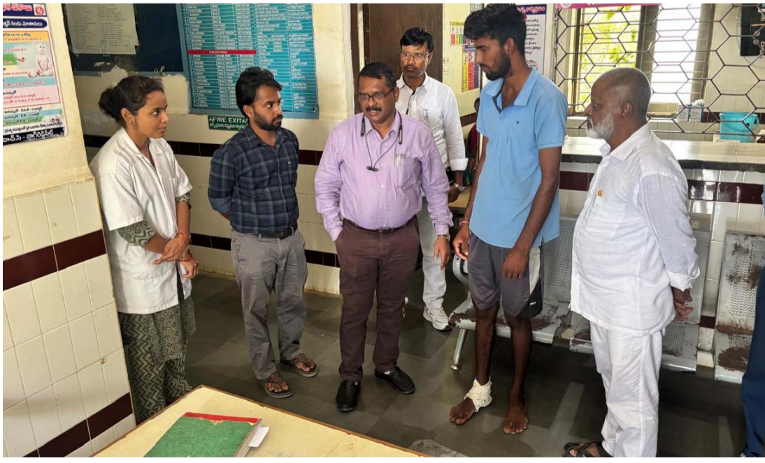
చికిత్సలు అందుతున్నాయా మందులు ఇస్తున్నారా వైద్యం వైద్యులు, సిబ్బందికి సలహాలు సూచనలు చేశారు. మంచిగా అందుతుందా అనే వివరాలను అడిగి తెలుసుకొని