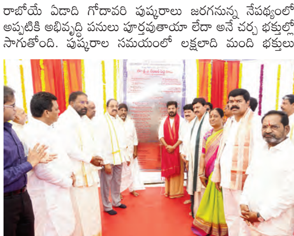
రాజీయే ఏడాది గోదావరి పుష్కరాలు జరగనున్న నేపథ్యంలో అప్పటికే అభివృద్ధి పనులు పూర్తవుతాయా లేదా అనే చర్చ భక్తుల్లో సాగుతోంది. పుష్కరాల సమయంలో లక్షలాది మంది భక్తులు

భద్రాద్రి కొత్తగూడెం జిల్లా ప్రతినిధి, మే 31, ప్రజా జ్యోతి : దక్షిణ ఆయాధ్యగా పేరుగాంచిన భద్రాచలం శ్రీ సీతారామచంద్ర స్వామి వారి ఆలయ అభివృద్ధికి తెలంగాణ ప్రభుత్వం భారీ ప్రణాళిక రూపొందించినప్పటికీ, పనులు ఇంకా ప్రారంభం కాకపోవడం రామభక్తుల్లో ఆందోళన కలిగిస్తోంది. భద్రాద్రిని యాదాద్రి తరహాలో అభివృద్ధి చేయాలనే లక్ష్యంతో ప్రభుత్వం మొత్తం రూ.586 కోట్ల మార్గం పానుకు ఆమోదం తెలిపి, తొలి విడతగా రూ.351 కోట్లు విడుదల చేసింది. అభివృద్ధి పనులకు అవసరమైన సరఫరా సేకరణ పూర్తిచేయడంతో పాటు, శ్రీరామసవమి సందర్భంగా ముఖ్యమంత్రి రేవంత్ రెడ్డి శంకుస్థాపన కూడా చేశారు. ఆలయ ఆగమశాస్త్ర నియమాలకు అనుగుణంగా చిన్న జీయర్ స్వామి ఆధ్వర్యంలో 15 ఉపాలయాల్లోని 72 దేవతామూర్తులను తాత్కాలికంగా ఇతర ప్రాంతానికి తరలించి జీర్ణోద్ధరణ అనుజ్ఞ కార్యక్రమాలను నిర్వహించారు. అనంతరం పనుల అమలు బాధ్యతలను ఆర్ అండ్ బి శాఖకు అప్పగించారు. అయితే ఆన్లైన్ టెండర్లను ఆహ్వానించినప్పటికీ తొలి విడత టెండర్లకు కాంట్రాక్టర్ల సుంచి స్పందన రాకపోవడంతో ప్రక్రియ నిలిచిపోయింది. దీంతో అధికారులు రెండోసారి టెండర్లను ఆహ్వానించారు. ప్రస్తుతం అందరి దృష్టి ఈ టెండర్లపైనే ఉంది. ఇదిలా ఉండగా జూన్ నుంచి పర్యాటకం ప్రారంభం కానుండటం, జూలై-ఆగస్టు నెలల్లో గోదావరి వరదల ప్రభావం ఉండే అవకాశం ఉండటంతో పనులు మరింత ఆలస్యమయ్యే పరిస్థితులు కనిపిస్తున్నాయి. మరోవైపు