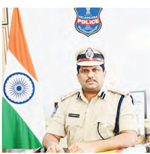
నిర్వహించనున్న జాతీయ లోక్ అదాలత్లో వివిధ రకాల

● జూన్ 20న నిర్వహించనున్న జాతీయ లోక్ అదాలత్ను ప్రజలు సద్దినయోగం చేసుకోవాలి ● సత్వర న్యాయ పరిష్కారానికి లోక్ అదాలత్ ఉత్తమ వేదిక - ఎస్పీ డివి శ్రీనివాస్ రావు