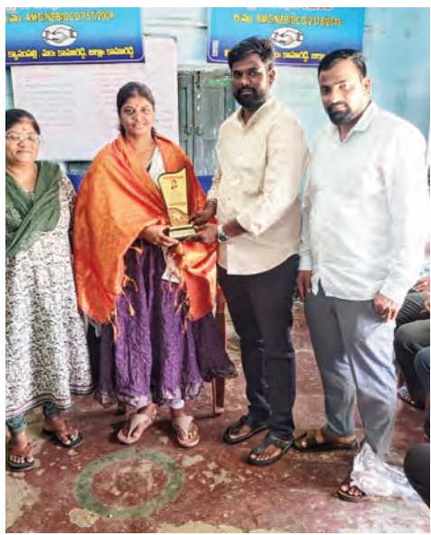
ప్రజలతో సత్సంబంధాలు కొనసాగిస్తూ పంచాయతీ పరిపాలనను సమర్థవంతంగా నిర్వహించిన అధికారిణిగా ప్రపంచి గుర్తింపు పొందారని అన్నారు. గ్రామ అభివృద్ధి కోసం పగలు రాత్రి అనే తేడా లేకుండా కృషి చేశారని కొనియాడారు. పాలకవర్గ సభ్యులు మాట్లాడుతూ గ్రామంలోని ప్రతి అభివృద్ధి కార్యక్రమంలో ఆమె చురుకైన పాత్ర పోషించారని పేర్కొన్నారు. మహిళా సంఘాల సభ్యులు, మహిళా సంఘాల అధ్యక్షులు మాట్లాడుతూ మహిళల అభివృద్ధికి, స్వయం సహాయక సంఘాల బలోపేతానికి ప్రపంచి అందించిన సహకారం ఎంతో విలువైనదని తెలిపారు. మహిళలకు ప్రభుత్వ పథకాలపై అవగాహన కల్పించి, వారికి లెకునమైన సహాయ సహకారాలు అందించడంలో ముందుదేవారని చెప్పారు. గ్రామంలో మహిళా సాధికారతకు ఆమె చేసిన కృషి ప్రశంసనీయమని కొనియాడారు. గ్రామ యువకులు, గ్రామ పెద్దలు మాట్లాడుతూ గ్రామంలో నిర్వహించిన పలు అభివృద్ధి కార్యక్రమాలు, పారిశుధ్య చర్యలు, హరితహారం కార్యక్రమాలు, ప్రజా సమస్యల పరిష్కారంలో ప్రపంచి చూపిన అంతిమభావం అందరికీ ఆదర్శమని పేర్కొన్నారు. గ్రామ ప్రజలందరినీ కలుపుకొని పనిచేయడం ఆమె