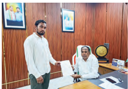
కుటుంబ సభ్యులతో పాటు కాగ్రెస్ పార్టీ సీనియర్ నాయకులు ఎమ్మెల్యే కు ప్రత్యేక కృతజ్ఞతలు తెలియజేశారు.