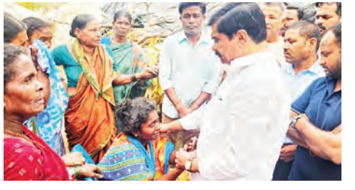
నిమిత్తం 18000 ఆర్థిక సహాయం అందజేశారు.