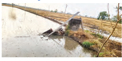
తెలిపారు. సంబంధిత విద్యుత్ శాఖ అధికారులు పరిస్థితిని పరిశీలించి మరమ్మత్తు పనులు చేపట్టారు.

రుద్రూర్,జూన్ 7 (ప్రజా జ్యోతి): రుద్రూర్ మండల కేంద్రంలో ఆదివారం సాయంత్రం ఉరుములు, మెరుపులు, ఈదురు గాలులతో కూడిన వర్షం బీభత్సం సృష్టించింది. లింగంపల్లి శివారులోని పంట పొలాల్లో ఉన్న విద్యుత్ స్తంభం, ట్రాన్స్ ఫార్మర్ నేలకొరిగాయి. అలాగే రహదారి పక్కన ఉన్న భారీ వృక్షాలు కూలిపోవడంతో కొంతసేపు వాహనాల రాకపోకలకు అంతరాయం ఏర్పడింది. భారీ వర్షం కారణంగా మండల కేంద్రంలోని పలు ప్రాంతాల్లో రహదారులు జలమయమయ్యాయి. రోడ్డుపై చెట్లు పడిపోవడంతో ప్రయాణికులు ఇబ్బందులు ఎదుర్కొన్నారు. సమాచారం అందుకున్న పోలీసులు వెంటనే ఘటన స్థలానికి చేరుకుని జీసీబీ సహాయంతో రహదారిపై కూలిన చెట్లను తొలగించారు. అనంతరం ట్రాఫిక్ ను పునరుద్ధరించి వాహనాల రాకపోకలను సజావుగా కొనసాగించారు. విద్యుత్ స్తంభం, ట్రాన్స్ ఫార్మర్ దెబ్బతినడంతో పరిసర ప్రాంతాల్లో విద్యుత్ సరఫరాకు అంతరాయం కలిగినట్లు స్థానికులు