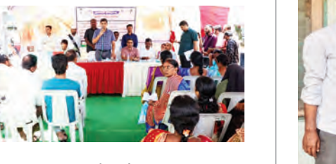
గుంతులు ఏర్పాటు చేసుకోవాలని తెలిపారు. వర్షాకాలం దృష్ట్య మురుగు కాలువల పూడిక తొలగింపు, నీరు నిల్వ కాకుండా చర్యలు, పారిశుధ్య నిర్వహణ, తాగునీటి సరఫరా, రహదారులు, వీధి పరిశుభ్రత, వర్షావరణ పరిరక్షణ, మౌలిక వసతుల అభివృద్ధి, ప్రజా సేవల మెరుగుదల సాధ్యమవుతుందని పేర్కొన్నారు. ఘన వ్యర్థాల నిర్వహణ నియమాలు--2026, సుక్ష్మీకర్ణ మార్గదర్శక మేరకు ప్రతి కుటుంబం చెత్తను తడి, పొడి వ్యర్థాలుగా వేరు చేసి మున్సిపాలిటీకి అందించాలని సూచించారు. "జల్ సంపదం -- జల్ భాగిదాల్" కార్యక్రమం కింద వర్షపు నీటి సంరక్షణకు ప్రాధాన్యత ఇవ్వాలని, ప్రతి ఇంటి వద్ద ఇంకుడు గుంతులు ఏర్పాటు చేసుకోవాలని తెలిపారు. వర్షాకాలం దృష్ట్య మురుగు కాలువల పూడిక తొలగింపు, నీరు నిల్వ కాకుండా చర్యలు, పారిశుధ్య నిర్వహణ, తాగునీటి సరఫరా, రహదారులు, వీధి పరిశుభ్రత, వర్షావరణ పరిరక్షణ, మౌలిక వసతుల అభివృద్ధి, ప్రజా సేవల మెరుగుదల సాధ్యమవుతుందని పేర్కొన్నారు. ఘన వ్యర్థాల నిర్వహణ నియమాలు--2026, సుక్ష్మీకర్ణ మార్గదర్శక మేరకు ప్రతి కుటుంబం చెత్తను తడి, పొడి వ్యర్థాలుగా వేరు చేసి మున్సిపాలిటీకి అందించాలని సూచించారు. "జల్ సంపదం -- జల్ భాగిదాల్" కార్యక్రమం కింద వర్షపు నీటి సంరక్షణకు ప్రాధాన్యత ఇవ్వాలని, ప్రతి ఇంటి వద్ద ఇంకుడు