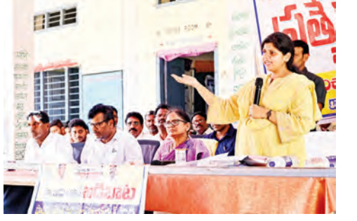
రానున్న వర్షాకాలాన్ని దృష్టిలో ఉంచుకొని సీజనల్ వ్యాధులు ప్రజలకుండా ముందస్తు జాగ్రత్తలు పాటించాలని, పరిశుభ్రత పరిశుభ్రతను పాటించడం ద్వారా ఈగలు, దోమల వ్యాప్తిని నివారించవచ్చని, తద్వారా వ్యాధులు సోకకుండా కాపాడుకోవచ్చని సూచించారు. ఘన వ్యర్థాల నిర్వహణ నిబంధనలను