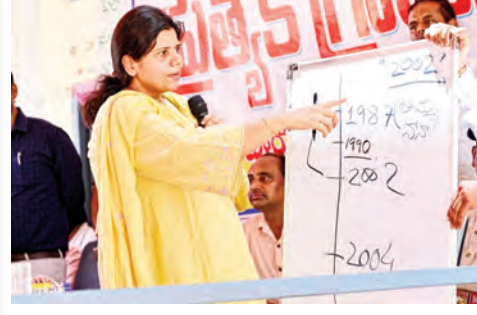
కల్పించారు. ఈ సందర్భంగా కలెక్టర్ మాట్లాడుతూ, వ్యవసాయ రంగంలో నిజామాబాద్ జిల్లా అరుదైన ఘనతను కలిగి ఉన్నదని గుర్తు చేశారు. పరిస్థితులకు అనుగుణంగా పంటల మార్పిడి విధానాన్ని అవలంబిస్తూ సాగు రంగంలో ప్రత్యేకతను చాటాలని రైతులకు సూచించారు. ఎల్ నీస్ ప్రభావం వల్ల తక్కువ వర్షపాతం నమోదయ్యే అవకాశాలు ఉన్నందున, తక్కువ సాగు నీటి అవసరం కలిగిన పంటలను విత్తుకోవాలని