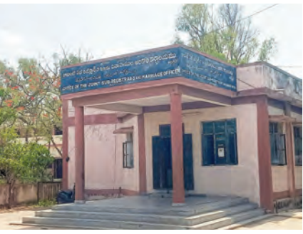
చేయాలనుకునే మధ్యతరగతి ప్రజల్లో ఆందోళన వ్యక్తమవుతోంది. కొత్త మార్కెట్ విలువలు అమల్లోకి రావడంతో రిజిస్ట్రేషన్ ఖర్చులు రూ. 20 వేల నుంచి రూ. 25 వేల వరకు పెరిగే అవకాశముందని స్థానికులు పేర్కొంటున్నారు.

నందిపేట, ప్రజాజ్యోతి తెలంగాణ ప్రభుత్వం తాజాగా మార్కెట్ విలువలను పెంచడంతో నందిపేట మండలంలో స్థలాల రిజిస్ట్రేషన్ ఖర్చులు భారీగా పెరగనున్నాయి. నందిపేట గ్రామంలో నివాస ప్రాంతాల గణం విలువ ఇప్పటివరకు ఉన్న రూ. 1,100 నుంచి రూ. 1,700కు పెరగగా, ప్రధాన రహదారి వెంట ఉన్న ప్రాంతాల్లో గణం విలువను రూ. 1,900గా నిర్ణయించారు. అలాగే మండలంలోని పలు గ్రామాల్లో గణం విలువ రూ. 500 నుంచి రూ. 900కు పెరిగింది. ఈ పెంపుతో స్థలాల కొనుగోలు, రిజిస్ట్రేషన్ చేసుకునే వారికి అదనపు ఆర్థిక భారం వడసంది. గతంలో తక్కువ ఖర్చుతో పూర్తయ్యే రిజిస్ట్రేషన్లు ఇప్పుడు దాదాపు రెట్టింపు రుసుము చెల్లించాల్సి వస్తుంది. దీంతో రియల్ ఎస్టేట్ రంగంలో పాటు షాట్లు కొనుగోలు చేయాలనుకునే మధ్యతరగతి ప్రజల్లో ఆందోళన వ్యక్తమవుతోంది. కొత్త మార్కెట్ విలువలు అమల్లోకి రావడంతో రిజిస్ట్రేషన్ ఖర్చులు రూ. 20 వేల నుంచి రూ. 25 వేల వరకు పెరిగే అవకాశముందని స్థానికులు పేర్కొంటున్నారు.