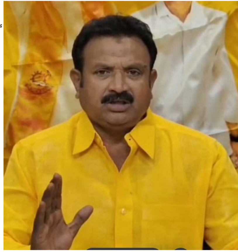
ప్రజల కోసం నిత్యం శ్రమిస్తుంటే దానికి ఓర్వలేక వివేకవంతులు మాట్లాడటం సబబు కాదని వారికి హెచ్చరించారు.

ప్రశ్నించారు ఇప్పుడు ప్రభుత్వ కళాశాలలో విద్యార్థుల మంచి మార్పులు సంపాదించి కార్పొనేట్ కళాశాలకు దీటుగా నిలబడారంటే దాని వెనుక ఉన్న కృషి గౌరవ మంత్రి వర్గం నారా లోకేశ్ బాబు గారిదే అని తెలిపారు. మరొక పక్కనుండి గులకు ఉద్యోగ అవకాశాలు కల్పించాలని గౌరవ ముఖ్యమంత్రివర్గం నారా చంద్ర బాబునాయుడు మరియు మంత్రివర్గం నారా లోకేశ్ బాబు ఇరువురు విదేశాలకు వెళ్లి పారిశ్రామిక వేత్తలను కలిసి పరిశ్రమలు తెచ్చేందుకు ఎంతో కృషి చేస్తున్నారని తెలిపారు గత వైసిపి ప్రభుత్వం లో పారిశ్రామిక వేత్తలు వైసిపి నాయకుల యొక్క దౌర్జన్యంతో వారిపై దాడులు చేసినందుకు ఎన్నో పరిశ్రమలు ఇతర రాష్ట్రాలకు వెళ్లిపోయాయి అని తెలిపారు చంద్రబాబు నాయుడు గారి కృషితో కియా సంస్థను స్థాపించడం వల్ల వేల మందికి ఉద్యోగాలు లభించాయి అని తెలిపారు ఇప్పటికే నూరు మందికి మంచి రాష్ట్ర అభివృద్ధికి సహకరించాలని కూటమి ప్రభుత్వం