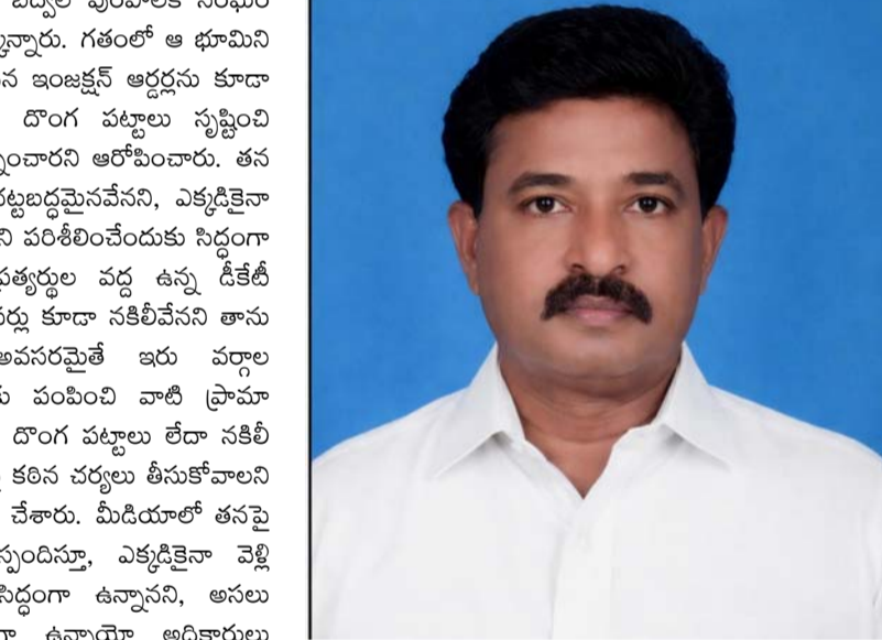
పరిశీలన జరగాలని తాను కోరుతున్నట్లు తెలిపారు.

చేసి, వాటిని అమలు చేయాలని బద్వోల్ పురపాలక సంఘం కమిషనర్ కు సూచించింది పేర్కొన్నారు. గతంలో ఆ భూమిని తనకు విక్రయించిన వ్యక్తి పొందిన ఇంజక్షన్ ఆర్డర్లను కూడా పట్టించుకోకుండా, అక్రమంగా డౌంగ్ పట్టాలు సృష్టించి నిర్మాణాలు చేపట్టేందుకు ప్రయత్నించారని ఆరోపించారు. తన వద్ద ఉన్న అన్ని భూ పత్రాలు చట్టబద్ధమైనవేనని, ఎక్కడికైనా వచ్చి ఏ అధికారి ఎదురైనా వాటిని పరిశీలించేందుకు సిద్ధంగా ఉన్నానని తెలిపారు. అలాగే ప్రత్యర్థుల వద్ద ఉన్న డీటీటీ ఫారాలు, అగ్రిమెంట్ స్టాంపు పేపర్లు కూడా సకీలవేనని తాను గట్టిగా చెబుతున్నానన్నారు. అవసరమైతే ఇరు వర్గాల పత్రాలను నిపుణుల పరిశీలనకు పంపించి వాటి ప్రామాణికతను నిర్ధారించాలని కోరారు. డౌంగ్ పట్టాలు లేదా సకీల పత్రాలు ఎవరి వద్ద ఉన్నా వారిపై కఠిన చర్యలు తీసుకోవాలని ప్రభుత్వాన్ని అధికారులకు విజ్ఞప్తి చేశారు. మీడియాలో తనపై వచ్చిన కథనాల నేపథ్యంలో స్పందిస్తూ, ఎక్కడికైనా వెళ్లి నిజానిజాలు తేల్చుకునేందుకు సిద్ధంగా ఉన్నానని, అసలు రికార్డులు ఎవరివద్ద సక్రమంగా ఉన్నాయో అధికారులు తేలుస్తారని చెప్పారు. ఈ వ్యవహారంపై బహిరంగంగా రికార్డుల