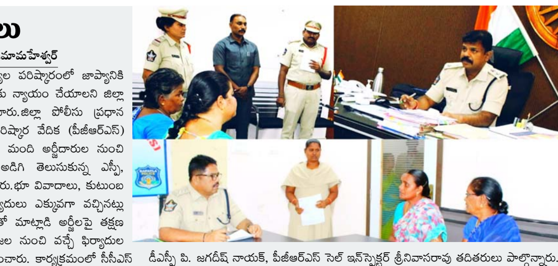
డిఎస్సీ పి. జగదీష్ నాయక్, వీజిఆర్ఎస్ సెల్ ఇన్ సుక్రర్ త్రినివాసరావు తదితరులు పాల్గొన్నారు.

బాధితులకు న్యాయం జరిగేలా తక్షణ చర్యలు తీసుకోవాలి: ఎస్సీ ఉపాధి హామీ కమిషన్ జూన్ 8 ప్రజా జ్యోతి జిల్లా ప్రతినిధి ప్రజా సమస్యల పరిష్కారంలో జాప్యానికి తావులేకుండా ఫిర్యాదులపై వెంటనే విచారణ చేపట్టి బాధితులకు న్యాయం చేయాలని జిల్లా ఎస్సీ బి. ఉపాధి హామీ కమిషన్ పోలీసు అధికారులను ఆదేశించారు. జిల్లా పోలీసు ప్రధాన కార్యాలయంలో సోమవారం నిర్వహించిన ప్రజా సమస్యల పరిష్కార వేదిక (వీజిఆర్ఎస్) కార్యక్రమంలో జిల్లాలోని పలు ప్రాంతాల నుంచి వచ్చిన 43 మంది అర్జీదారుల నుంచి వివరాలను స్వీకరించారు. వారి సమస్యలను స్వయంగా అడిగి తెలుసుకున్న ఎస్సీ, చట్టపరిధిలో పరిష్కారానికి చర్యలు తీసుకుంటామని హామీ ఇచ్చారు. భూ వివాదాలు, కుటుంబ కలహాలు, ఆర్థిక లావాదేవీల మోసాలకు సంబంధించిన ఫిర్యాదులు ఎక్కువగా వచ్చినట్లు తెలిపారు. అనంతరం సంబంధిత పోలీసు స్టేషన్ల అధికారులతో మాట్లాడి అర్జీలపై తక్షణ విచారణ చేపట్టి నివేదికలు సమర్పించాలని ఆదేశించారు. ప్రజల నుంచి వచ్చే ఫిర్యాదుల పరిష్కారంలో నిరర్థకం ప్రదర్శిస్తే కఠిన చర్యలు తప్పవని హెచ్చరించారు. కార్యక్రమంలో సీసీఎస్