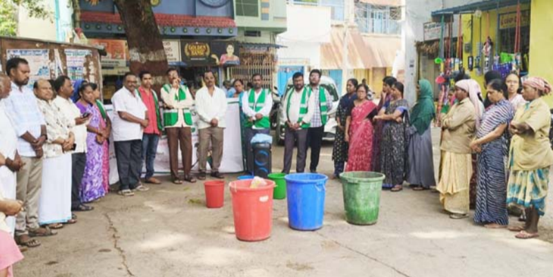
కమిషనర్ పిలుపునిచ్చారు. ఈ కార్యక్రమంలో శానిటరీ ఇన్ స్పెక్టర్లు, మేస్ట్రీలు, పారిశుధ్య కార్మికులు, వ్యాపారవేత్తలు మరియు స్థానిక ప్రజలు పాల్గొన్నారు.

నిలిపివేయాలని పిలుపునిచ్చారు. ఇకపై నిబంధనల ప్రకారం వేరు చేసిన పొడి చెత్తను మాత్రమే మున్సి పల్ వాహనాలు సేకరిస్తాయని స్పష్టం చేశారు. పట్టణంలోని ప్రభుత్వ ప్రైవేటు హాస్టళ్లు, ఫంక్షన్ హాళ్లు, కళ్యాణ మండపాలు, హోటళ్లు, రెస్టారెంట్లు, అపార్ట్ మెంట్ల నిర్వాహకులు తడి చెత్తను కంపోస్టింగ్ ద్వారా ప్రాసెస్ చేసి, ప్లాస్టిక్ రహిత పొడి వ్యర్థాలను మాత్రమే మున్సిపల్ సిబ్బందికి అందించాలని సూచించారు. 'స్వస్థ ఆంధ్రప్రదేశ్' లక్ష్య సాధనలో భాగంగా బోతంచెర్లను పరిశుభ్ర పట్టణంగా తీర్చిదిద్దేందుకు ప్రతి పౌరుడు బాధ్యతగా వ్యవహరించి చెత్త వర్గీకరణకు సహకరించాలని