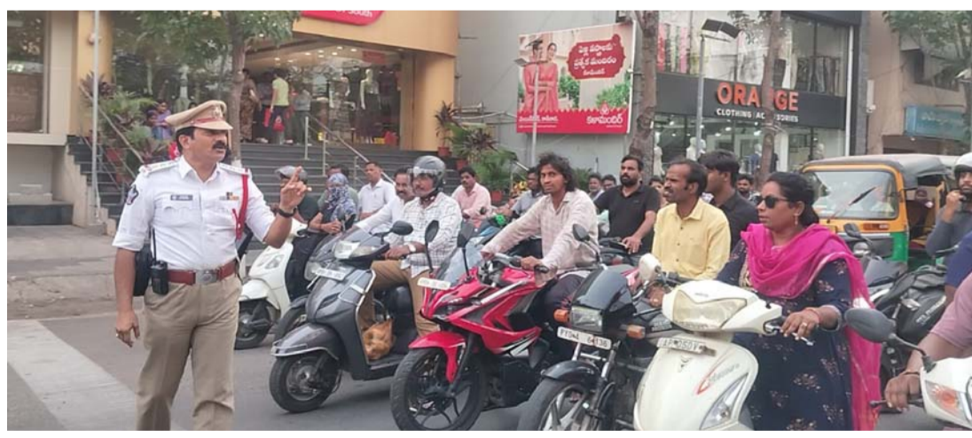
చేయడం వంటి ప్రమాదకర చర్యలకు దూరంగా ఉండాలని హెచ్చరించారు. నిరర్థకంగా వాహనాలు నడపడం వల్లే ఎక్కువ రోడ్డు ప్రమాదాలు జరుగుతున్నాయని వివరించారు. ట్రాఫిక్ సిగ్నల్ వద్ద రెడ్ సిగ్నల్ వడినప్పుడు స్టాప్ లైన్ మెంక వాహనాలను ఆపాలని, ట్రాఫిక్ నిబంధనలు ఉల్లంఘించిన వారికి ఆటోమేటిక్ ఫైన్ జనరేషన్ సిస్టమ్ ద్వారా ఈ-