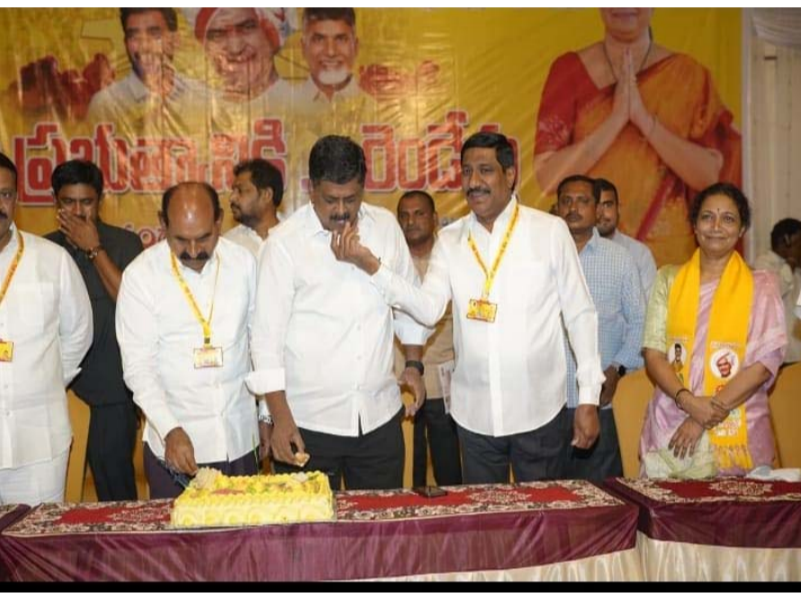
చాటుకుంది అలగునూరు ప్రాజెక్టు కూడా తామే పూర్తి చేస్తామని హామీ ఇస్తున్నామనే “సర్” విషయంలో ప్రజలు, ఓటర్లు, పార్టీ నేతలు, కార్యకర్తలు మరింత అప్రమత్తంగా ఉండాలి చాలామంది ఓట్లు తీసేందుకు, డొంగ ఓట్లు నమోదుకు వైసిపీ నేతలు ప్రయత్నిస్తున్నారు. కేవలం పరిపాలన, అభివృద్ధి కాకుండా, ఇటువంటి అంశాలపై కూడా నేతలు అప్రమత్తంగా ఉండాలి సంద్యాల జిల్లా అభివృద్ధికి అర్థిక శాఖ మంత్రి అన్ని విధాలుగా సహకరిస్తున్నారని స్థానిక సంస్థల ఎన్నికల్లో టిడిపి జెండా రెపరపలాడాని ప్రతి కార్యకర్త, ప్రతి అంటికి వెళ్లి ప్రభుత్వ పనితీరును వివరించాల్సిన బాధ్యత ఉంది