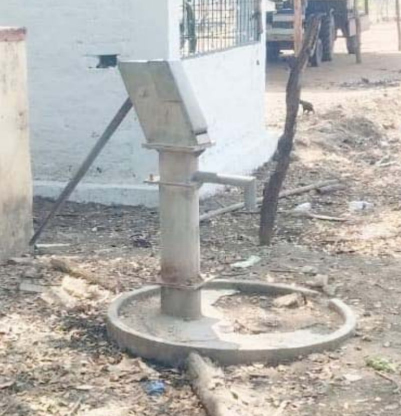
దరతి కలిసి పెద్దఎత్తున ఆందోళన కార్యక్రమాలు చేపడతామని హెచ్చరిస్తున్నారు.

బోరింగ్ పాడై దాదాపు మూడు వారాలు గడుస్తున్నా అధికారులు స్పందించకపోవడం వల్ల స్థానికులు తీవ్ర ఆగ్రహం వ్యక్తం చేస్తున్నారు. సమస్యను పలుమార్లు సంబంధిత అధికారుల దృష్టికి తీసుకెళ్లినా ఎలాంటి చర్యలు తీసుకోలేదని ఆరోపిస్తున్నారు. ప్రజల మౌలిక అవసరమైన తాగునీటి సమస్యను కూడా పట్టించుకోకపోవడం బాధాకరమని గ్రామస్తులు మండిపడుతున్నారు. తక్షణ చర్యలు తీసుకోవాలి గ్రామాల్లో తాగునీటి సమస్యలు తలెత్తకుండా చూడాల్సిన ఆర్డల్యూస్ అధికారులు, పంచాయతీ సిబ్బంది వెంటనే స్పందించాలని గ్రామస్తులు డిమాండ్ చేస్తున్నారు. సందిగామపాడు పాఠశాల సమీపంలోని బోరింగ్ కు యుద్ధ ప్రాతిపదికన మరమ్మతులు నిర్వహించి తాగునీటి సమస్యను దరతి కలిసి పెద్దఎత్తున ఆందోళన కార్యక్రమాలు చేపడతామని హెచ్చరిస్తున్నారు.