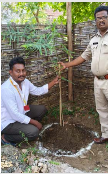
ప్రపంచ పర్యావరణ దినోత్సవాన్ని పురస్కరించుకుని ప్రతి ఒక్కరూ కనీసం ఒక మొక్కను నాటాలని పిలుపునిచ్చారు. పాఠశాలలు, కళాశాలలు, ఆస్పత్రులు, బస్స్టాప్లు తదితర ప్రదేశాల్లో మొక్కలు నాటి వాటిని సంరక్షించాలని సూచించారు. మొక్క పెంపకం ద్వారా ఆక్సిజన్ స్థాయిలు పెరిగి, పర్యావరణ సమతుల్యత కాపాడబడుతుందని వివరించారు. కూనవరం గ్రామంలో నిర్వహించిన ఈ కార్యక్రమంలో స్థానిక నాయకులు, గ్రామస్తులు, యువత పాల్గొని మొక్కలు నాటి పర్యావరణ పరిరక్షణకు తమ వంతు సహకారం అందించారు. "ఒక్కొక్కరం ఒక మొక్క నాటితే భవిష్యత్ తరాలకు వచ్చని ప్రకృతిని అందించగలుగుతాం" అని వారు పేర్కొన్నారు.