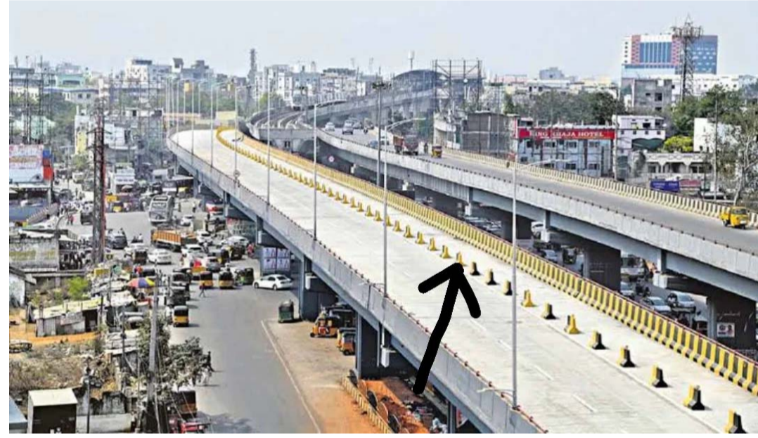
ఇన్స్పెక్షన్ అండ్ ట్రాన్స్ఫార్మేషన్ ఇన్స్పెక్టర్ ప్రాజెక్టు కింద ఈ పనులను ఈపీసీ (ఇంజనీరింగ్, ప్రొక్యూర్మెంట్ అండ్ కన్స్ట్రక్షన్) టర్నీటీ విధానంలో కేఎన్ఆర్ కన్స్ట్రక్షన్ చేపట్టనుంది. ఎల్ఐడీ నగర్ నుంచి ఎయిర్పోర్టుకు వెళ్లే మార్గంలో ప్రస్తుతం ఈ 3 జంక్షన్ల వద్ద తీవ్రంగా ట్రాఫిక్ రద్దీ నెలకొంటోంది. మరో ముఖ్యంగా గత 10 ఏళ్లలో మిగిలే, బదంగిపేట్, అల్యాన్ గూడ వంటి ప్రాంతాల్లో జనాభా గణనీయంగా పెరగడంతో పాటు.. వాహనాల రాకపోకలు కూడా భారీగా పెరిగాయి. దీంతో ఈ ప్రాంతాల నుంచి సగంకొత్త వెళ్లే ప్రయాణికులతో నిత్యం ఆ మార్గంలో ట్రాఫిక్ ఇబ్బందులు తలెత్తుతున్నాయి. ఈ 6 లేన్ల షైఫ్ వర్ నిర్మాణం పూర్తి అయితే నగర తూర్పు భాగాన్ని విస్తరించిన దక్షిణ ప్రాంతాలతో అనుసంధానం చేయడంలో కీలక పాత్ర పోషించనుందని సంబంధిత వర్గాలు పేర్కొంటున్నాయి. మిగిలే, బదంగిపేట్, అల్యాన్ గూడ ప్రాంతాల ప్రజలకు వేగవంతమైన రాకపోకలు అందుబాటులోకి రానున్నాయని చెబుతున్నాయి. అలాగే ఎల్ఐడీ నగర్ జంక్షన్ నుంచి సంతోష్ నగర్ మీదుగా పాతబస్ వైపు వెళ్లే ప్రయాణికులకు కూడా ప్రయాణ సమయం భారీగా తగ్గి అవకాశం ఉందని వెల్లడిస్తున్నాయి. మున్సిపల్ అధికారులు వెల్లడించిన వివరాల ప్రకారం.. ఈ షైఫ్ వర్లకు సంబంధించి.. త్వరలోనే భూసేకరణ, విద్యుత్ లైన్లు, నీటి పైపులు వంటి యుటిలిటీ షిఫ్టింగ్ పనులను ప్రారంభించనున్నట్లు తెలుస్తోంది. ఈ ప్రాజెక్ట్ పూర్తి అయితే నగర తూర్పు ప్రాంతాల్లో ట్రాఫిక్ సమస్యలు గణనీయమైన ఉపశమనం లభిస్తుందని అధికారులు భావిస్తున్నారు.