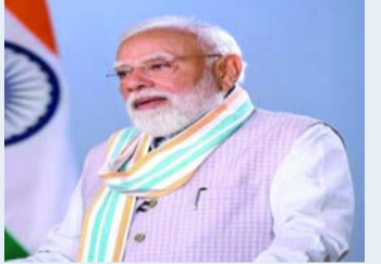
నా పిలుపుతో బంగారం

ప్రభుత్వ పాఠశాలల్లో విద్యార్థులకు పరిశుభ్రత, నాణ్యత, రుచితో కూడిన మధ్యాహ్న భోజనం అందించేందుకు ప్రభుత్వం ఏర్పాటు చేస్తున్న స్టార్డ్ కిచెన్లపై మాజీ ముఖ్యమంత్రి వైఎస్ జగన్ చేసిన వ్యాఖ్యలను విద్య, బడి శాఖల మంత్రి నారా లోకేశ్ తీవ్రంగా ఖండించారు. విద్యార్థుల సంక్షేమం కోసం ప్రభుత్వం చేపడుతున్న కార్యక్రమాలను కూడా రాజకీయ కోణంలో - మిగతా3లో