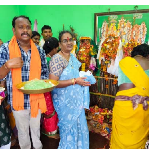
అట్టహాసంగా ముగింపు వేడుకలు!..